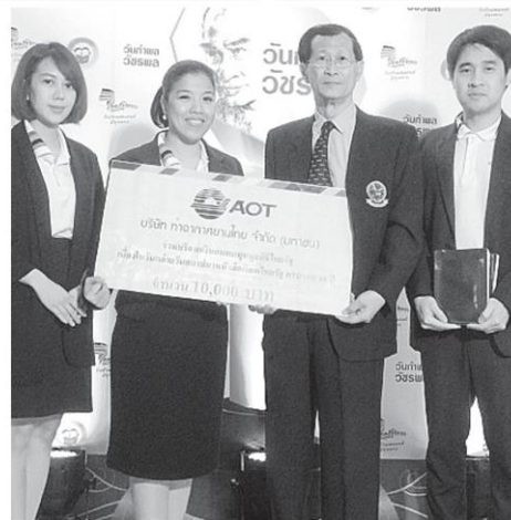
ทีมงานสื่อสารองค์กร บมจ.การท่าอากาศยานแห่งประเทศไทย ร่วมบริจาคเงิน 10,000 บาท.