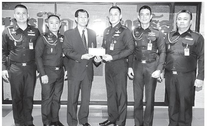
คณะตัวแทนเลขาธิการกองทัพบก มายินดีกับ นสพ.ไทยรัฐ และร่วมบริจาคเงิน 10,000 บาท ให้ มูลนิธิไทยรัฐ ช่วยการศึกษาเยาวชนของชาติ.