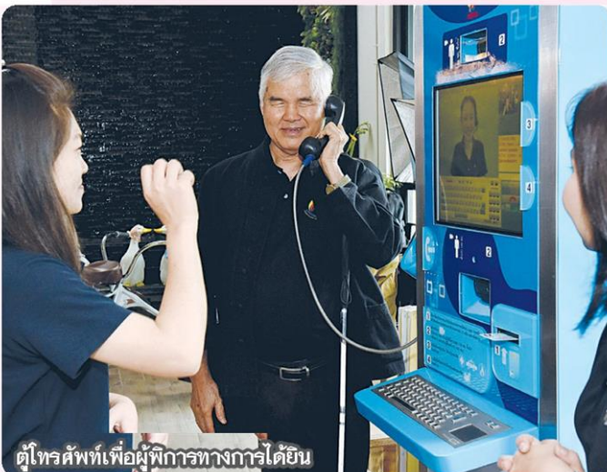
ตู้โทรศัพท์สำหรับผู้พิการทางการได้ยิน

ศักยภาพของแต่ละบุคคล ได้มีงานทำ และสภาพแวดล้อมไม่เป็นอุปสรรค โดยภารกิจแรกที่ดำเนินการคือ การศึกษา แต่การจะให้เด็ก ๆ เข้าโรงเรียน และเรียนร่วมกับคนปกติได้นั้น ก็ต้องมีเตรียมความพร้อม มีศูนย์การศึกษาพิเศษสำหรับคนพิการ โดยที่บ้านยิ้มสู้มี โครงการบ้านเด็กยิ้มสู้ เตรียมความพร้อมและทักษะพื้นฐานให้กับเด็กเล็กผู้พิการทุกประเภท เตรียมความพร้อมเพื่อให้สามารถเรียนร่วมกับเด็กทั่วไปได้ เพื่อให้ได้รับ โอกาสทางการศึกษา มากขึ้น"