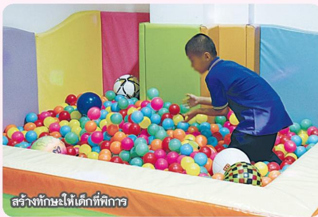
สร้างทักษะให้เด็กที่พิการ

อีกภารกิจของบ้านยิ้มสู้ ในขั้นต่อมา เป็น ห้องถ่ายทำ VDO ภาษามือ สำหรับผู้พิการ และ Application SQR/GR เพื่อให้ผู้พิการหูหนวกสามารถอ่านและทำความเข้าใจเนื้อหาในหนังสือต่าง ๆ ช่วยให้เข้าถึงข้อมูลข่าวสารในรูปแบบภาษามือ และมี ศูนย์บริการถ่ายทอดการสื่อสารแห่งประเทศไทย (TTRS) อำนวยความสะดวกด้านการติดต่อสื่อสารระหว่างผู้พิการด้วยตนเองและกับคนปกติ ที่มีความพร้อมลำดับต้น ๆ ในภูมิภาคเอเชียแปซิฟิก โดยมีผู้ใช้บริการมากกว่า 2 แสนคนต่อปี