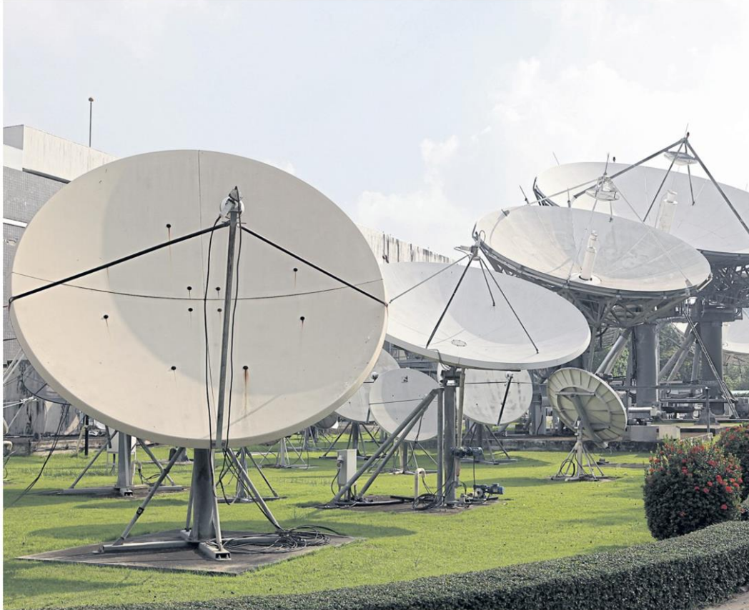
Satellite dishes behind Thaicom's headquarters in Nonthaburi province. TAWATCHAI KEMGUMNERD

The government plans to change its satellite request to Thaicom as it considers exploration for natural resources. B2