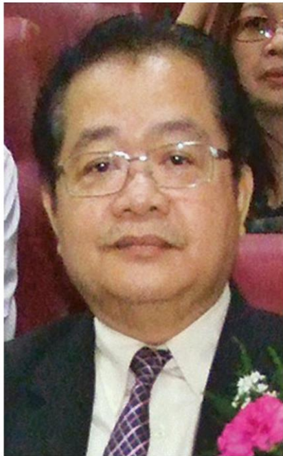
เรื่องวิทย์ เกษสุวรรณ