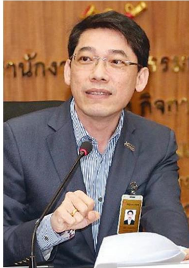
ก่อกิจ ด้านชัยวิจิตร

องค์กรธุรกิจเอกชนที่ผู้บริหารเติบโตมาจากผู้ปฏิบัติจึงมักจะประสบความสำเร็จในผลประกอบการ