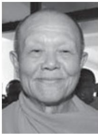
ทัตตชีโว

มากอีกแล้วจ้าจาก ... “ธุดงค์ธรรมชัย” อีเวนต์ใหญ่ประจำปีของ “ลัทธิงานบิณ” วัดพระธรรมกาย ที่นำสงฆ์ในเครือข่ายเดินบนเส้นทาง “ผู้ปราบมาร” บู๊ด้วยกลีบดอกไม้ ผ่านพื้นที่หลายจังหวัด ... จัดมาต่อเนื่อง 4-5 ปี ท่ามกลางเสียงก่นด่า สร้างความเดือดร้อนตลอดเส้นทาง ... จนเมื่อปี 2559 ต้องปรับแผน ให้สงฆ์มากกว่าพันรูปไปเดินธุดงค์ในวัดแทน ... กระทั่งปีที่แล้ว