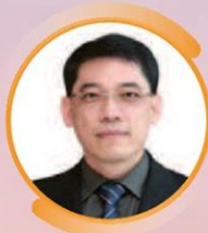
คุณก่อกิจ ด้านชัยวิจิตร รองเลขาธิการ กสทช.

Panel Discussion : "โครงสร้างพื้นฐานโทรคมนาคมกับการขับเคลื่อนประเทศไทยสู่สังคมดิจิทัล"