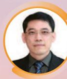
คุณก่อกิจ ด้านชัยวิจิตร รองเลขาธิการ กสทช.

Panel Discussion : "โครงสร้างพื้นฐานโทรคมนาคมกับการขับเคลื่อนประเทศไทยสู่สังคมดิจิทัล"