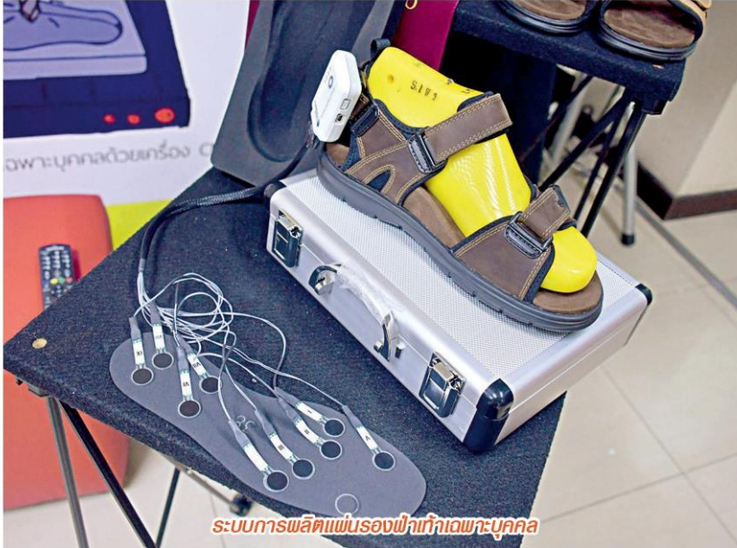
ระบบการผลิตแผ่นรองเท้าอัจฉริยะบุคคล