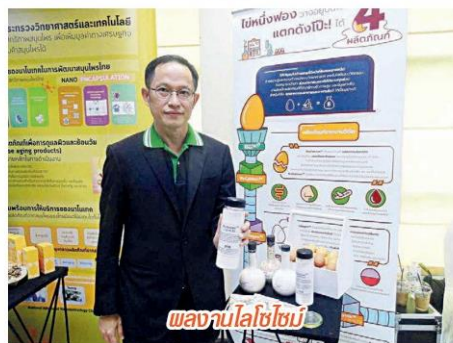
ผลงานไฮโลตวิจย

3. การสร้างเสริมสุขภาพและคุณภาพชีวิตคนไทย ด้วยนวัตกรรมเครื่องมือแพทย์ และบริการด้านสุขภาพและสาธารณสุขของประเทศ 4. การพัฒนาเคมีชีวภาพและเชื้อเพลิงชีวภาพ จากฐานความหลากหลายทางชีวภาพที่เป็นจุดแข็งของ