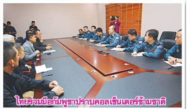
ไทยร่วมมือกับพญาปราบคอลเซ็นเตอร์ข้ามชาติ