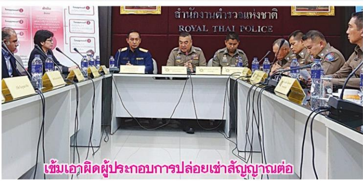
เข้มเอาผิดผู้ประกอบการปล่อยเช่าสัญญาณต่อ