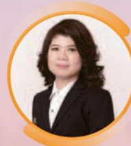
คุณเกศรา มัญชุศรี กรรมการและผู้จัดการ ตลาดหลักทรัพย์แห่งประเทศไทย