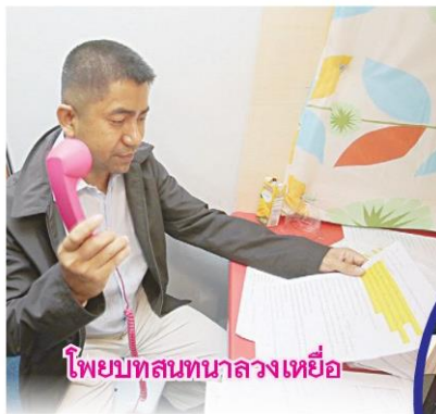
ไพบทูลสนทนาลวงเหยื่อ

จากการแกะรอยเส้นทางของขบวนการคอลเซ็นเตอร์ สิ่งหนึ่งที่พบและถือเป็นจุดสำคัญคือเส้นทางหมายเลขโทรศัพท์ของคนร้ายที่โทรฯเข้ามาหลอกลวงผู้เสียหายเป็นการโทรฯผ่านระบบ VOIP และเมื่อตรวจสอบลงลึกไปก็จะพบว่าเรื่องนี้มีช่องโหว่ที่กลุ่มผู้ให้บริการเช่าสัญญาณลักษณะให้เช่าเลขหมายสัญญาณ ตลอดจนกลุ่มบริษัทเอกชนได้นำเครื่องมือแปลงหมายเลข