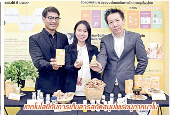
เทคโนโลยีกับการเก็บสารสกัดสมุนไพรคุณภาพใน

ใกล้แล้ว...กับงานประชุมวิชาการประจำปี 2561 ของสำนักงานพัฒนาวิทยาศาสตร์และเทคโนโลยีแห่งชาติ (สวทช.) หรือที่เรียกว่า "NAC2018" (แนค2018)