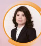
คุณเกศรา มัญชุศรี กรรมการและผู้จัดการ ตลาดหลักทรัพย์แห่งประเทศไทย