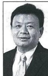
ฐากร ดัชนีสิทธิ์

นายฐากร ดัชนีสิทธิ์ เลขาธิการคณะกรรมการกิจการกระจายเสียง กิจการโทรทัศน์ และกิจการโทรคมนาคมแห่งชาติ (กสทช.) เปิดเผยภายหลังการประชุมคณะกรรมการ (บอร์ด) เมื่อวันที่ 7 มีนาคม 2561 ว่า ที่ประชุมมีมติให้ชะลอการประมูลการติดตั้งโครงการเน็ตประชารัฐ จำนวน 15,733 หมู่บ้าน เนื่องจากที่ประชุม กระทรวงดิจิทัลเพื่อเศรษฐกิจและสังคม (ดีอี) ได้มีมติให้กระทรวงดีอีดำเนินการติดตั้งเอง