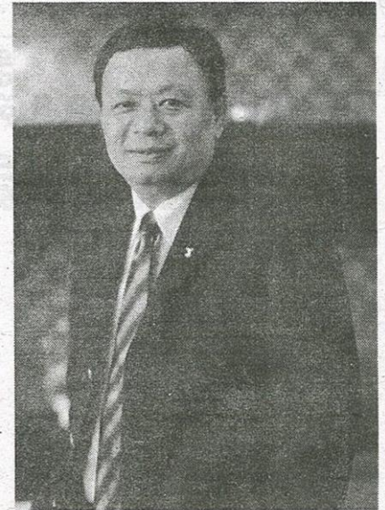
ฐากร ดัชนีสิทธิ์

ส่วนเรื่องการประมูลคลื่นความถี่ย่าน 1800 MHz และ 900 MHz ขณะนี้สำนักงาน กสทช. ยังไม่ได้รับหนังสือตอบกลับจากสำนักงานคณะกรรมการกฤษฎีกาว่าเรื่องดังกล่าว กสทช.ชุด ปัจจุบันมีอำนาจดำเนินการได้หรือไม่ ดังนั้น การ ประมูลคลื่นความถี่ย่าน 1800 MHz และ 900 MHz จึงยังไม่สามารถดำเนินการได้ในขณะนี้