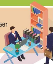
ที่มา : ประชาชาติธุรกิจรวบรวม

สำหรับรายได้จากสัญญานี้ เมื่อหักรายจ่ายแล้วเบ็ดเสร็จทีโอทีจะมีรายได้ปีละ 4,500 ล้านบาท โดยกลุ่มดีแทคลงทุนสร้างโครงข่าย และทีโอทีจะเช่าเพื่อนำมาใช้กับคลื่น 2300 MHz แล้วขายค่าเช่าคืนให้ดีแทค 60% ที่เหลือทีโอทีจะใช้งานเอง โดย 20% ให้บริการ 4G อีก 20% ใช้ให้บริการ fixed wireless broadband หากทีโอทีขยายตลาดได้ก็จะมีรายได้ในส่วนที่เพิ่มอีก โดยคาดว่าหลังลงนามในสัญญาแล้วจะใช้เวลา 6-7 เดือนในการวางโครงข่ายพร้อมรับ “เน็ตประชารัฐ” เฟส 2 สำหรับโครงการติดตั้งอินเทอร์เน็ตความเร็วสูง “เน็ตประชารัฐ” เฟสแรก 24,700 หมู่บ้าน ได้ส่งมอบให้กระทรวงดิจิทัลเพื่อเศรษฐกิจและสังคม (ดีอี) ตรวจสอบ