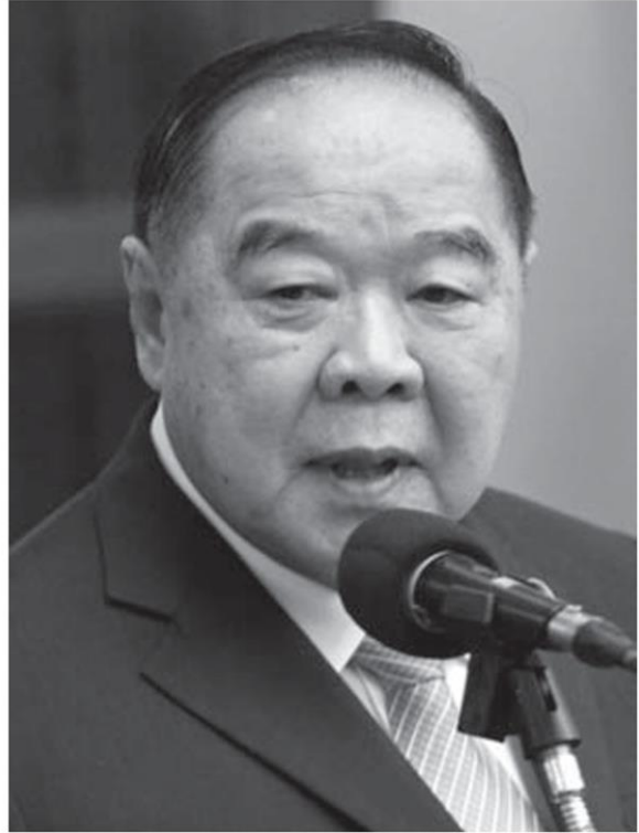
พล.อ.ประวิตร วงษ์สุวรรณ

เพียงงวดเดียว หรือน้อยงวดที่สุด เพื่อให้มีสภาพเป็นต้นทุนจม ไม่สามารถผลัดภาระไปยังผู้บริโภคได้โดยง่าย แม้แต่ พ.ร.บ. องค์กรจัดสรรคลื่นความถี่ พ.ศ. 2553 มาตรา 42 ก็ยังพูดถึง การชำระเงินประมูลคลื่นเพื่อประกอบกิจการทางธุรกิจในกิจการ กระจายเสียงและโทรทัศน์ ว่า เงินที่ได้จากการประมูลต้องชำระ เมื่อได้รับใบอนุญาต ซึ่งหมายความว่า ต้องชำระก่อนเดียว แต่ที่ผ่านมามีการแบ่งงวด เพราะค่าประมูลคลื่นมีมูลค่าสูง จึง บรรเทาภาระผู้ประกอบการ เพียงแต่ต้องกำหนด และประกาศ อย่างชัดเจนก่อนประมูล และผู้เข้าร่วมประมูลถือว่ายอมรับงวด เงินดังกล่าวแล้ว