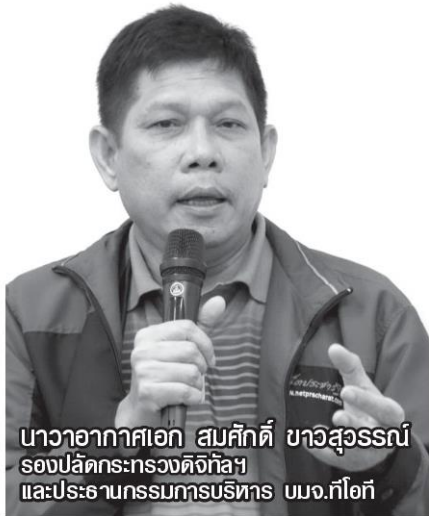
นาวาอากาศเอก สมศักดิ์ ขาวสุวรรณ์ รองปลัดกระทรวงดิจิทัลฯ และประธานกรรมการบริหาร บมจ.ทีโอที

ทีโอที ออกแบบจุดติดตั้งอินเทอร์เน็ตความเร็วสูงในพื้นที่ชายขอบใหม่ จาก 445 จุด เหลือ 295 จุด ลดความซ้ำซ้อนพื้นที่ติดตั้ง ประหยัดงบประมาณกว่า 280 ล้านบาท