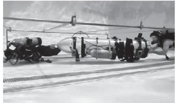
กระสวยหมูป่า

นักดำน้ำชาวอังกฤษ เพื่อยืนยันว่า นวัตกรรมใหม่ ที่ใช้เวลา คิดค้นเมื่อไม่กี่ชั่วโมงนั้น “ใช้งานได้จริง” ..อีกทั้งก่อน เดินทางมาเมืองไทย “อีลอน” ก็รับทราบถึงแผนการนำตัว