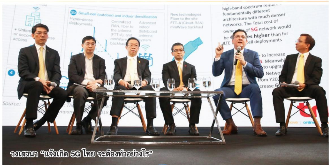
วงเสวนา “แจ้งเกิด 5G ไทย จะต้องทำอย่างไร”

วิถีชีวิตของมวลมนุษยชาติกำลังจะเปลี่ยนแปลงครั้งใหญ่ เมื่อโลกเข้าสู่ยุคของเทคโนโลยี 5G ซึ่งเป็นระบบการสื่อสารความเร็วสูงแบบไร้สายที่สามารถส่งข้อมูลในปริมาณมากกว่า 4G ถึง 1,000 เท่า ทำให้อุปกรณ์ที่จะมารองรับไม่ได้จำกัดเพียงแค่สมาร์ทโฟน แต่รวมไปถึงเครื่องมือเครื่องใช้และระบบสาธารณูปโภคทั้งหมด โดย 5G ยังเป็นพื้นฐานของ Internet of Thing และ Machine to Machine ซึ่งเป็นการสื่อสารระหว่างอุปกรณ์กับอุปกรณ์ต่างๆ