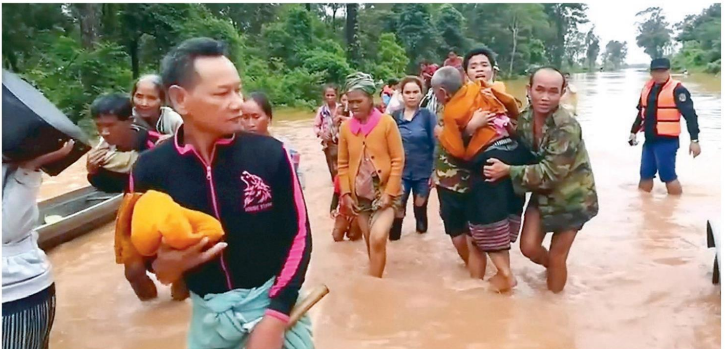
ลุยน้ำ - ชาวลาวที่ได้รับผลกระทบจากเขื่อนเซเปียน-เซินน้อยแตกจำนวนมากเดินผ่านพื้นที่น้ำท่วมอย่างทุลักทุเล โดยได้รับการช่วยเหลือจากเรือกู้ภัยนำส่งผู้พื้นที่ปลอดภัย ที่เมืองสะหนามไซ แขวงอัตตะปือ สปป.ลาว เมื่อวันที่ 25 กรกฎาคม

ทางการ สปป.ลาวเร่งช่วยผู้ประสบภัยจาก เหตุเขื่อนเซเปียน-เซินน้อย ในแขวงอัตตะ ปือ สปป.ลาว เกิดแตกทรุดตัว ทำให้ปริมาณ น้ำมหาศาลไหลบ่าเข้าท่วมบ้านเรือนราษฎร ชาวบ้านกว่า 6,600 คนต้องกลายเป็นคนไร้ บ้าน ต้องอพยพประชาชนไปยังที่ปลอดภัย