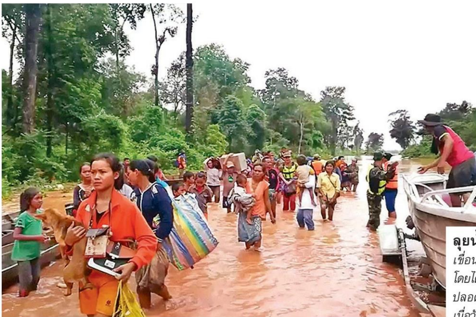
ลุยน้ำ - ชาวลาวที่ได้รับผลกระทบจากเขื่อนแตกจำนวนมากเดินผ่านพื้นที่น้ำท่วม โดยได้รับการช่วยเหลือจากเรือกู้ภัยนำส่งสู่พื้นที่ปลอดภัยที่เมืองสะหนามไซ แขวงอัตตะปือ เมื่อวันที่ 25 กรกฎาคม

ทางการ สปป.ลาวเร่งช่วยผู้ประสบภัยจากเหตุเขื่อนเซเปียน-เซินน้อย ในแขวงอัตตะปือ สปป.ลาว เกิดแตกทรุดตัว ทำให้ปริมาณน้ำมหาศาลไหลบ่าเข้าท่วมบ้านเรือนราษฎรชาวบ้านกว่า 6,600 คนต้องกลายเป็นคนไร้บ้าน ต้องอพยพประชาชนไปยังที่ปลอดภัย