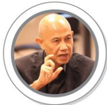
Suthichai Yoon veteran journalist