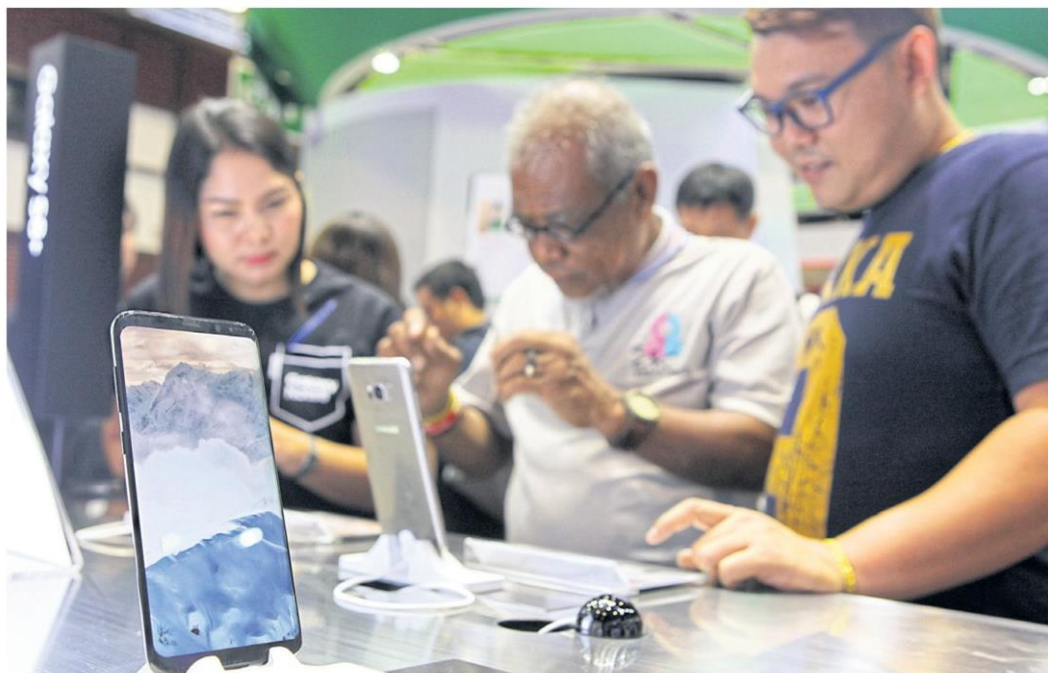
Visitors check out smartphones at a mobile fair. The adoption of 5G is expected to create exponentially better network services for all sectors. TAWATCHAI KEMGUMNERD

development of its network quality nationwide to offer 30% faster 4G services to more than 40.6 million subscribers since the end of September.