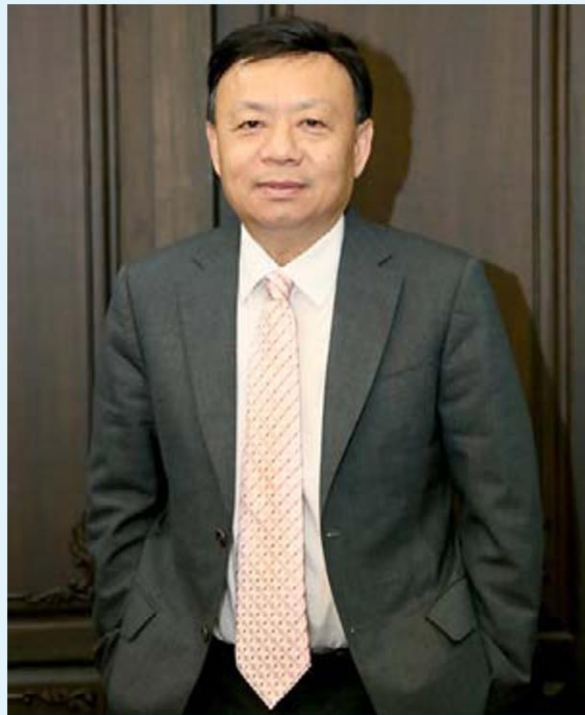
ฐากร ตัณฑสิทธิ์ เลขาธิการคณะกรรมการกิจการกระจายเสียง กิจการโทรทัศน์ และกิจการโทรคมนาคมแห่งชาติ (กสทช.)

กสทช. จึงจะทบทวนการประเมินมูลค่าคลื่นความถี่ที่จะนำมาประมูลเสียใหม่ โดยไม่อ้างอิงจากราคาเดิม แต่ต้องเป็นราคาที่สะท้อนความต้องการคลื่นความถี่ที่สมเหตุสมผลเหมาะสมกับบริบทอุตสาหกรรม และส่งเสริมการพัฒนาเศรษฐกิจดิจิทัล