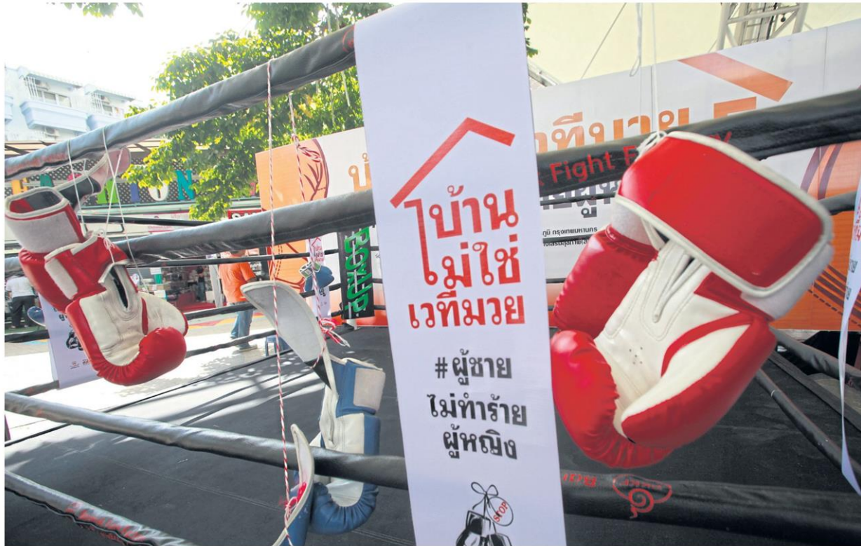
A boxing ring at the Women and Men Progressive Movement Foundation is decorated with a banner that says 'A Home Is Not A Boxing Ring #MenDon'tHurt Women'. The foundation is launching a campaign to raise awareness about domestic violence.