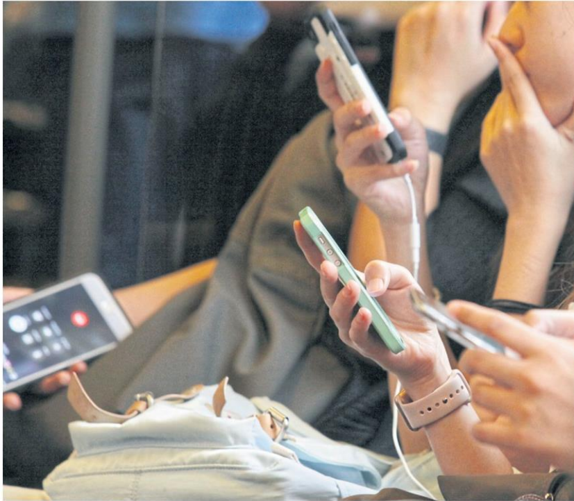
People watch digital content on smartphones while taking mass transit. APICHIIT JINAKUL