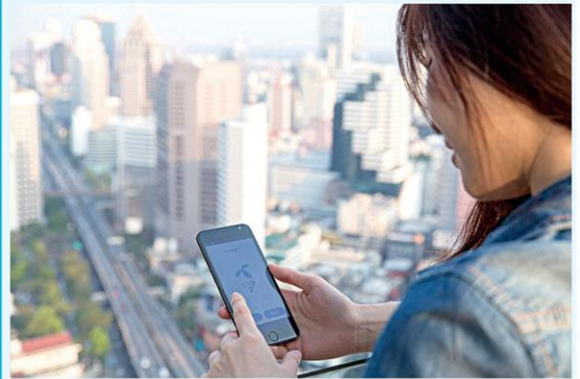
ดังนั้น ประเทศไทยไม่จำเป็นต้องรีบประมูลคลื่น 700

อย่างไรในประเทศที่มีความพร้อมในการก้าวสู่ 5จี เช่น สวิตเซอร์แลนด์ เยอรมนี หรือแม้แต่ประเทศจีนนั้น ล้วนต้องมีการสร้างระบบนิเวศทางดิจิทัลเพื่อเตรียมพร้อมในการรองรับเทคโนโลยี 5จีให้สมบูรณ์เสียก่อนถึงจะประมูลคลื่น