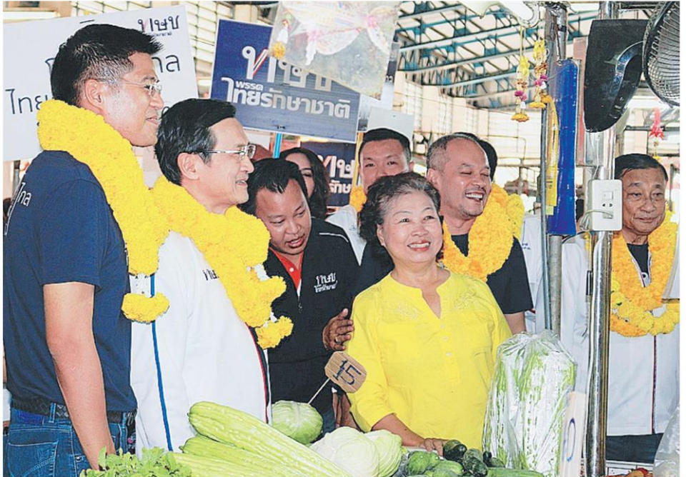
▲ ขายของผิด ร.ท.ปรีชาพล พงษ์พานิช หัวหน้าพรรคไทยรักชาติ พาแกนนำพรรคลงพื้นที่เดินพบปะพ่อค้าแม่ค้าในตลาดร่วมใจเทศบาลนครพิษณุโลก รับฟังเสียงสะท้อนต่างบ่นเศรษฐกิจแย่ขายของไม่ค่อยได้.

กกต.ไม่สวน ☆ ต่อจากหน้า 1 "ประยุทธ์" ชิงปมร้อน โยน 7 เลือช้ขาดย้าประเทศไทย ต้องแก้ปัญหของเราเอง ระดมจัดอีเวนต์ใหญ่ตีปีบสวัสดิการรัฐ ชั่วกรมการเมืองมูมิโตะต่อ ปชป.หยันกัมพูชายังกล้าโชว์ ชัยม 3 จุดล้มเหลวรัฐบาลคสช. ปูดนอมินีทหารเหิมชื่อเสียงลวงหน้า-แจกถึงขยะกทม. พท.เหินมูเจิบพวกฝึกแล้วแสดกแล้วการตรวจสอบ "เจ็ทน้อย" วยอย่าจันบับองค์กรอิสระ บิดเบี้ยวคาใจ กกต.เลือกพื้นที่ติดป้ายหาเสียง "เหวง" แวะแหวันถูกประจานทั่วโลก "เพื่อชาติ" และรัฐบาล กู้เครดิตส่งเทียบเชิญเอง "สมศักดิ์" ปัดจุ่นไม่เคยต่อรองเก้าอี้ รมต.