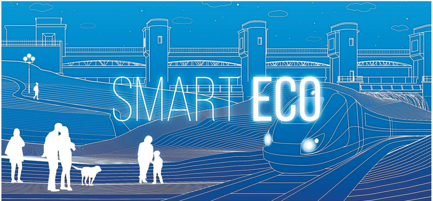
An artist's rendition of the smart city concept in the Eastern Economic Corridor province of Rayong. The EEC spans Rayong, Chon Buri and Chachoengsao.