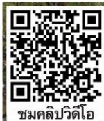
ชมคลิปวิดีโอ

นักศึกษามหาวิทยาลัยมหิดล ร่วมกิจกรรมแสดงพลัง โดยมีแกนนำผลัดกันขึ้นปราศรัยวิพากษ์วิจารณ์การยุบพรรคอนาคตใหม่และการทำงานของรัฐบาล พร้อมร่วมกันร้องเพลง“เพื่อมวลชน” โดยเปิดแฟลชจากโทรศัพท์มือถือออกไปที่ลานพระราชบิดามหาวิทยาลัยมหิดล ศาลายา จ.นครปฐม เมื่อวันที่ 25 กุมภาพันธ์