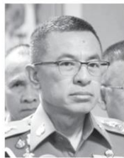
พล.ต.อ.สุวัฒน์ แจ้งยอดสุข

พบกันวันนี้ “สามผู้กำกับ” เริ่มต้นด้วยข่าวดี เมื่อสถานการณ์ภายในประเทศค่อยๆ คลี่คลาย โดยปราศจากการคุกคามจากโรคไวรัสโคโรนา-19 “ลุงตู่” พล.อ.ประยุทธ์ จันทร์โอชา นายกฯ/รมว.กลาโหม/ผอ.ศบค.และชุดปฏิบัติการ “ศบค.” มีความเป็นไปได้ว่า จะส่งคลายล็อกเฟส 5 โชนสีแดงเข้มเกือบทุกมิติ ไฮไลต์พุ่งเป้าไปที่ “ผับ/บาร์/คาราโอเกะ” เพราะการเปิดในยุค New Normal มาพร้อมกับ “กฎเหล็ก 22 ข้อ” เหมือนจับขังพิศถนบริการทั่วประเทศ ประมาณว่า ไม่ให้ตาย/ไม่ให้โต...●●...อย่างเป็นทางการ พุ่งนี้ (1 ก.ค.) คงชัดเจนแล้วว่า “อาบอบนวด” ได้ไปต่อหรือต้องถูกชั่งไปอีก 14 วัน ไปรอลุ้นกันอีกทีที่ “เฟส 6” ชาวลีกแต่ไม่ลับ “ธุรกิจอาบน้ำ” กลับมาแน่ ถึงขั้น “คนเชียร์แขก” แอบกระซิบถึงบรรดาลูกค้า “คนขี้เมื่อย” ผ่านกลุ่มไลน์เฉพาะย่านพร้อมเปิดแน่ต้นเดือนกรกฎาคม...●●...พล.อ.สมศักดิ์ รุ่งสิตา เลขาธิการ