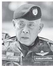
พล.ต.ท.กรวัชร ปานประภากร

สภาความมั่นคงแห่งชาติ (สมช.) แจงทุกภาคส่วน ยืนยันความจำเป็น ขยาย พ.ร.ก.ฉุกเฉิน ไปจนถึง 31 ก.ค. เพื่อรับมือสถานการณ์การเปิดภาคเรียน และการผ่อนคลายในเฟส 5 ส่วน “เนติบริการ” วิชาญ เครื่องงาม รองนายกฯ ออกมาไวพิชโควิด-19 เตรียมขงมาตรการของ พ.ร.ก.ฉุกเฉิน มาเพิ่มเติมใน พ.ร.บ.โรคติดต่อ เคสนี้เข้าทำดี...●●...ยังไม่ลืม ตั้ง