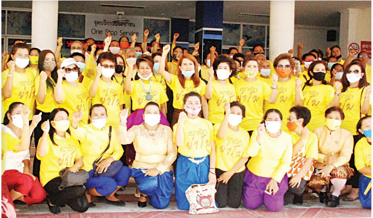
▲ไม่ให้อภัย...กลุ่มสตรีโคราชรักยาโมจากหลายภาคส่วนกว่า 100 คน สวมเสื้อเหลือง นุ่งโจงกระเบน แบบสตรีในยุคโบราณ เดิมทางไปแจ้งความพนักงานสอบสวน สภ.เมืองนครราชสีมา เพื่อดำเนินคดี 3 พิธีกรรายการช่องส่องผี ผิด พ.ร.บ.คอมพิวเตอร์ หมิ่นยาโมและย่าบุญเหลือ