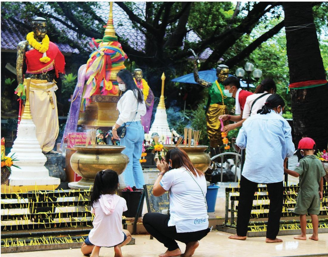
🏠 แห้วแห้ว - ชาวบ้านพากันไปไหว้ปูปั้นยาโมและน.ส.บุญเหลือ วีรสตรีชาวโคราช ที่วัดศาลาลอย อ.เมือง จ.นครราชสีมา หลังรายการ 'ช่องสองผืน' ดูหมิ่น ขณะเดียวกัน กลุ่มผู้นำสตรีในจังหวัดก็แจ้งจับพิธีกรและผู้ร่วมรายการอีก เมื่อวันที่ 13 ก.ค.

ที่ทำเนียบรัฐบาล นายแพทย์ ธิปไตย พลต.ประจำสำนักนายกรัฐมนตรี ในฐานะ กำกับดูแลสำนักงานพระพุทธศาสนาแห่งชาติ (พศ.) ให้สัมภาษณ์ถึงกรณีที พศ.ทำหนังสือ แจ้งไปยังวัดต่างๆ ไม่ให้ช่องสองผืนเข้าไปถ่าย ทำรายการในวัดว่า ให้ทุกวัดพิจารณาว่าหากขอ อนุญาตเข้ามาถ่ายทำรายการในลักษณะนี้ ให้ ทางวัดพิจารณาให้รอบคอบ จะห้ามหรือไม่ ห้ามเป็นเรื่องของทางวัด พศ.ไม่สามารถสั่งได้