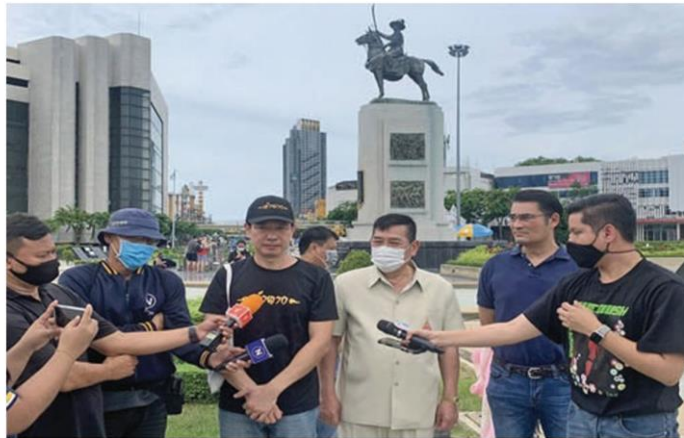
จับมาพระเจ้าตาก