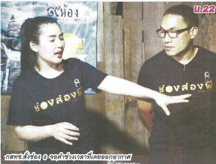
กสทช. สั่งช่อง 8 จอดำช่วงเวลาที่เคยออกอากาศ