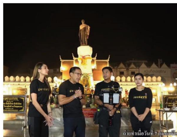
หน้าอนุสาวรีย์ย่าโม

แต่ที่มาอยู่ในความสนใจของสังคมอย่างกว้างขวางก็เกิดจาก เพจแหม่มโพธิ์ดำ ที่ออกมาตั้งคำถาม หลังจากที่ได้ตรวจสอบไลฟ์ ได้ข้อเท็จจริงอย่างฉฉฉฉ ฉฉฉฉ ฉฉฉฉ ฉฉฉฉ ฉฉฉฉ ฉฉฉฉ ที่ จ.เชียงใหม่ แต่กลับนำเงินไปใช้ผิดประเภท แถมยังเอาไปซื้อ