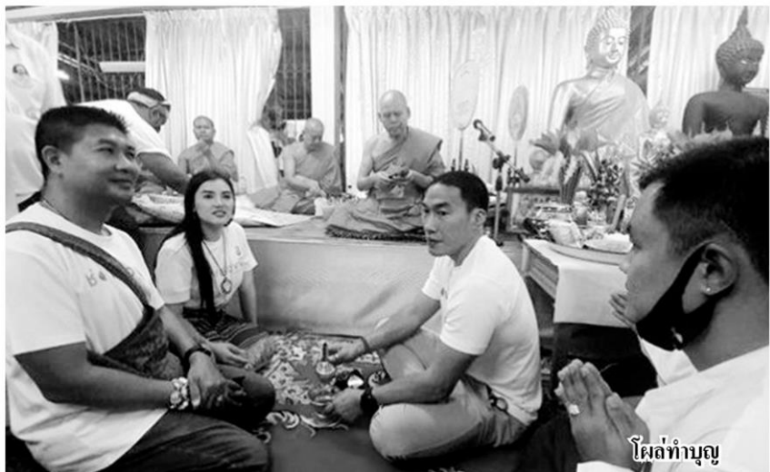
ไฟล์ทำบุญ

ซึ่งในรายการดังกล่าว เรนนี่ระบุว่าสามารถติดต่อกับดวงวิญญาณของสมเด็จพระเจ้ากรุงธนบุรีได้ แถมยังเล่าประวัติที่ไม่ตรงตามประวัติศาสตร์ อาทิ ระบุว่ากู้เงินยืมจากจีนแล้วไม่ใช้หนี้ หรือการออกรบโดยไม่สามารถทรงช้างได้ เพราะทรงช้างไม่เป็น