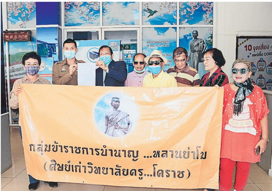
▲ แจ้งความอีก กลุ่มข้าราชการบำนาญหลานย่าโมแจ้งความตำรวจ สภ.เมืองนครราชสีมา ให้ดำเนินคดีที่ทีมงานรายการช่องส่องผี ผิด พ.ร.บ.คอมพิวเตอร์ หลังก่อนหน้านี้อสมาคมกำนันผู้ใหญ่บ้านและกลุ่มสตรีโคราชเข้าแจ้งความมาแล้ว.

ครบทุกคน ส่งร่างคำกล่าวขอขมาลาโทษมาให้แล้ว คณะกรรมการอยู่ระหว่างตรวจสอบแก้ไขให้ครบถ้วนสมบูรณ์ แจงค่าใช้จ่ายทั้งหมดทางรายการต้องเป็นคนจ่าย หลังจาก กสทช.มีมติลงโทษที่วัดจิโถง 8 ให้พักออกรายการ หรือจอคำ 1 ครั้งช่วงเวลาที่