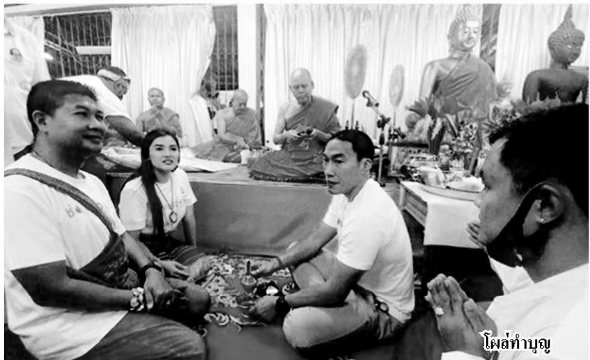
โศลท์ทำบุญ

ไม่เพียงแต่กรณีย่าโม ยังมีรายการช่องส่องผีที่ออกอากาศเมื่อวันที่ 4 ก.ย. 2562 ซึ่งถ่ายทำเรื่องของพระเจ้ากรุงธนบุรี หรือพระเจ้าตากสินมหาราช พระมหากษัตริย์ที่กู้บ้านเมืองจากพม่า และเป็นต้นราชวงศ์ธนบุรี โดยเป็นการจัดรายการที่วัดเขาขุนพนม จ.นครศรีธรรมราช ซึ่งในรายการดังกล่าว เรนนี่ระบุว่าสามารถติดต่อกับดวงวิญญาณของสมเด็จพระเจ้ากรุงธนบุรีได้ แลผมยังเล่าประวัติที่ไม่ตรงตามประวัติศาสตร์ อาทิ ระบุว่ากู้เงินยืมจากจีนแล้วไม่ใช่หนี้ หรือการออกรบโดยไม่สามารถทรงช้างได้ เพราะทรงช้างไม่เป็น