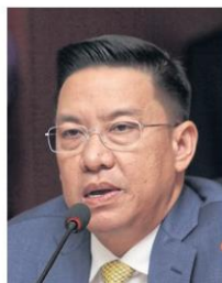
Buddhipongse: Little cooperation

Meanwhile, Facebook Thailand said it has temporarily deactivated the auto-translate feature on Facebook and Instagram while offering its apologies. Facebook said it is also revamping the quality of the feature.