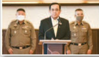
นายกฯสั่งเอาผิด 'แกนนำม็อบ' ผิดซ้ำ