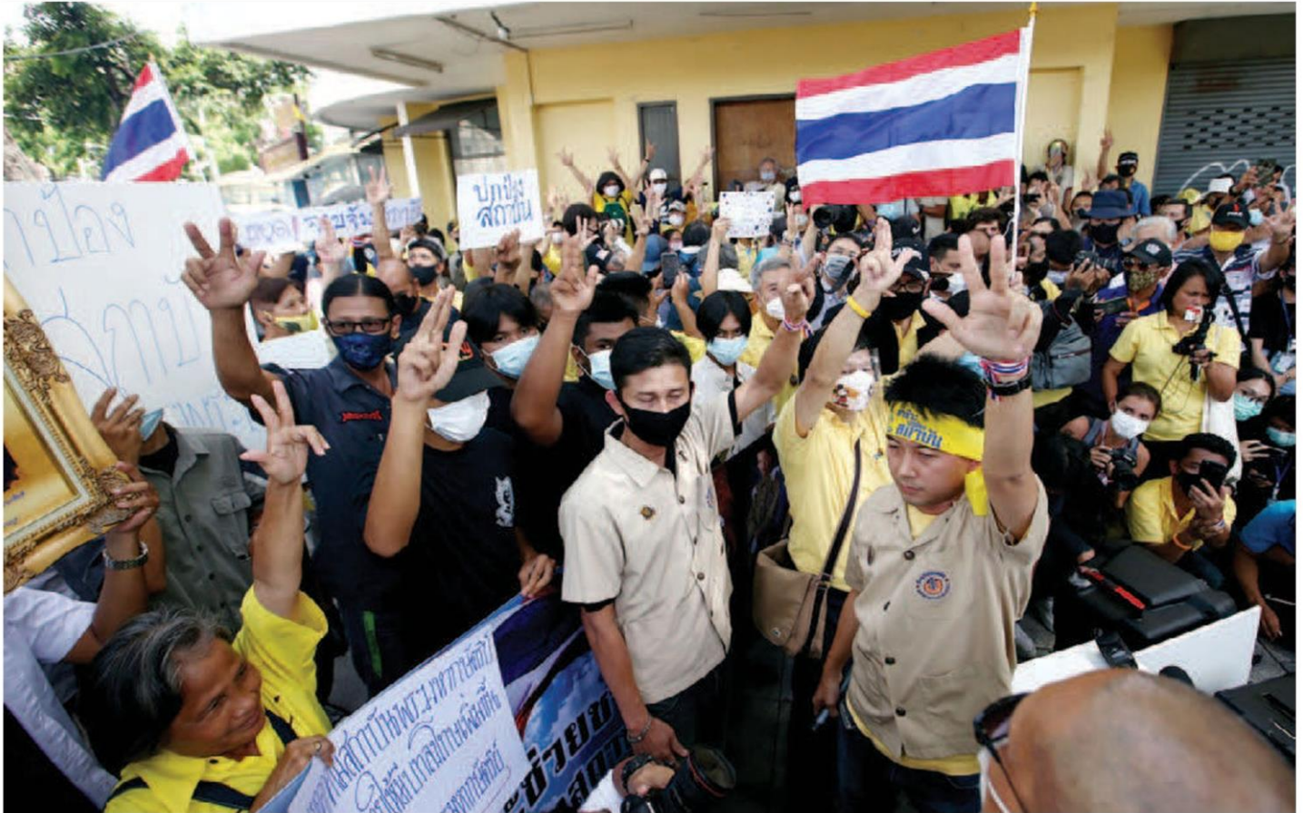
ปกป้องสถาบัน : กลุ่มอาชีพช่วยเหลือชาติ ร่วมกับนักศึกษาอาชีพจากหลายสถาบัน ทั้งศิษย์เก่า ศิษย์ปัจจุบัน และประชาชน ร่วมแสดงจุดยืนในการปกป้องสถาบันพระมหากษัตริย์ ที่บริเวณอนุสาวรีย์ประชาธิปไตย เพื่อขอให้กลุ่มต่างๆ หยุดยุยงปลุกปั่น โดยการชุมนุมเป็นไปอย่างสงบ วานนี้(30 ก.ค.)

หัวข้อข่าว: นายกษัตริย์พันแก่นนำมือปิดซ่า ห่วงยุยงปลุกปั่นให้การชุมนุมก่อความไม่สงบ