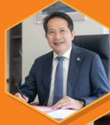
คุณสุพันธ์ มงคลสุธี ประธานสภาอุตสาหกรรมแห่งประเทศไทย