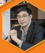
ดร.สมเกียรติ ตั้งกิจวานิชย์ ประธานสถาบันวิจัยเพื่อการพัฒนาประเทศไทย มูลนิธิสถาบันวิจัยเพื่อการพัฒนาประเทศไทย (ทีดีอาร์ไอ)