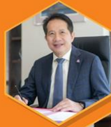
คุณสุพนธ์ มงคลสุธี ประธานสภาอุตสาหกรรมแห่งประเทศไทย