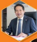
คุณสุพันธุ์ มงคลสุธี ประธานสภาอุตสาหกรรมแห่งประเทศไทย