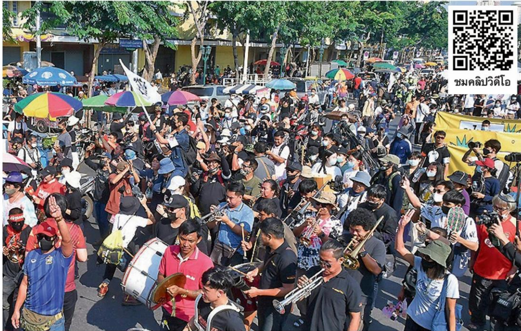
เคลื่อนขบวน - กลุ่มนักเรียนเลว เคลื่อนขบวนจากหน้ากระทรวงศึกษาธิการหลังจากทำกิจกรรมขับไล่ รมว.ศึกษาธิการ ไปยังอนุสาวรีย์ประชาธิปไตย เพื่อร่วมชุมนุมม็อบเฟสตัด โดยมีตำรวจกองร้อยน้ำหวานเดินขนาบข้าง เมื่อวันที่ 14 พฤศจิกายน

ขบวนไปในจุดดังกล่าวเพราะนายณัฐวุฒิ ทัพสุวรรณ รมว.ศึกษาธิการ ทำงานไร้ประสิทธิภาพ จะมีการแถลงเป็นการแสดงออกเชิงสัญลักษณ์ว่าจะไม่เอารัฐมนตรีคนนี้แล้ว