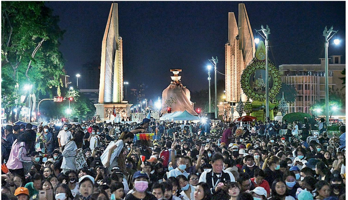
มีอบพริบ - นักเรียน นิสิตนักศึกษา และประชาชน ร่วมทำกิจกรรมที่อนุสาวรีย์ประชาธิปไตย ถนนราชดำเนิน กทม. โดยยื่นข้อเรียกร้อง 3 ข้อ เมื่อวันที่ 14 พฤศจิกายน

หัวข้อข่าว: แฉจนท.บุกล็อบบีลัดเพดาน เพนกวิ้นลั่นเวที