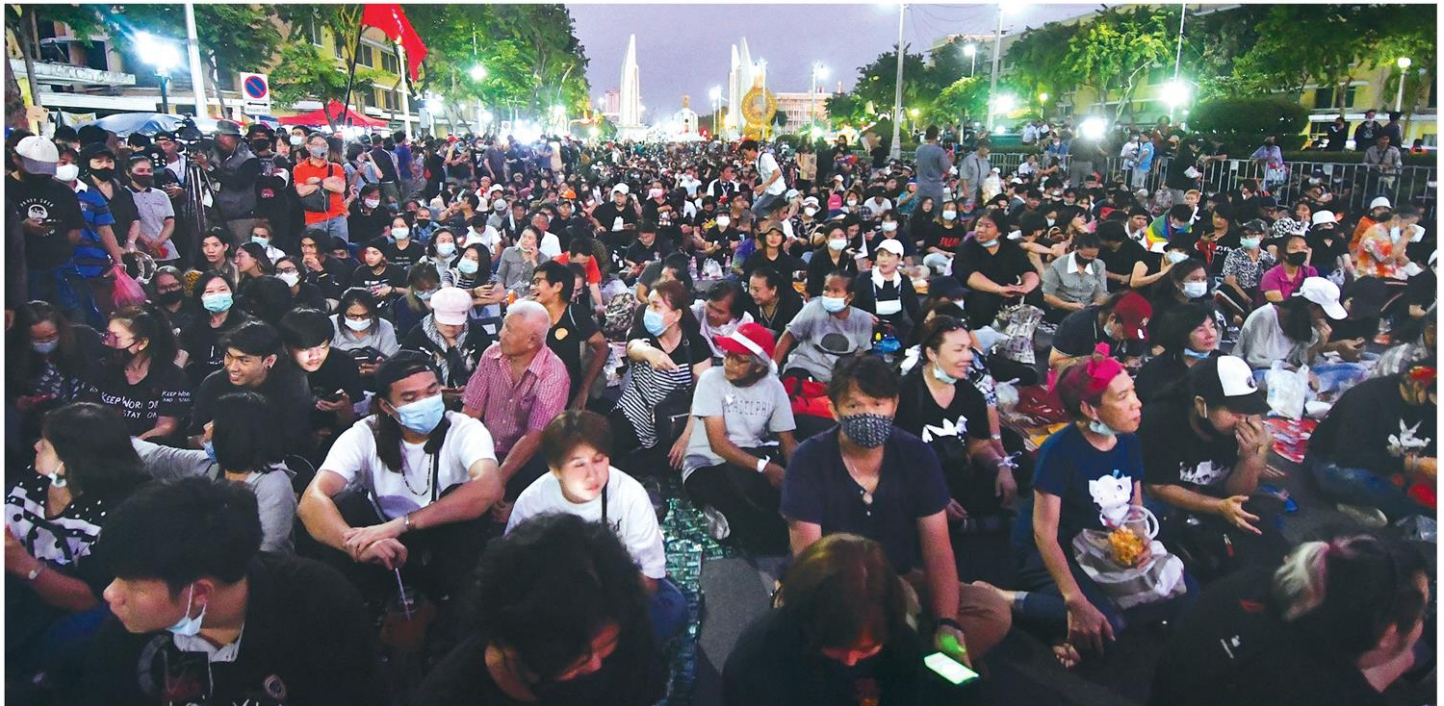
🏠 ยังไม่แฝ่ว - นักเรียน นักศึกษา ประชาชนยังคงแห่มากันเนืองแน่น ร่วมชุมนุมม็อบแฟลด์ ย้ำ 3 ข้อเรียกร้อง พร้อมนำผ้าที่เขียนข้อความแสดงเจตจำนงไปพันรอบอนุสาวรีย์ประชาธิปไตย และยิงเลเซอร์ข้อความ 'แก๊ได้ถ้าแก๊รัฐธรรมนุญ' เมื่อค่ำวันที่ 14 พ.ย.

ขณะที่เจ้าหน้าที่ผู้ขับรถน้ำระบุว่า เหตุที่เกิดขึ้นเนื่องจากกระแสรถน้ำมีค่าขายยังประกอบด้วยกระแงเป็นกระแงกันกระสุน ทั้งเป็นจุดอับสายตาทำให้มองไม่เห็นรถคันดังกล่าวจอดอยู่ เจ้าหน้าที่ได้ประสานหน่วยงานที่เกี่ยวข้องดูแลเพื่อรับคิดชอบเหตุการณ์ที่เกิดขึ้น พร้อมกำชับเจ้าหน้าที่เพื่อรักษาความปลอดภัยบริเวณโดยรอบอย่างเข้มงวด