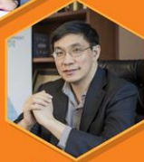
ดร.สมเกียรติ ตั้งกิจวานิชย์ ประธานสถาบันวิจัยเพื่อการพัฒนาประเทศไทย มูลนิธิสถาบันวิจัยเพื่อการพัฒนาประเทศไทย (ทีดีอาร์ไอ)