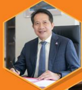
คุณสุพันธุ์ มงคลสุธี ประธานสภาอุตสาหกรรมแห่งประเทศไทย