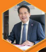
คุณสุพันธุ์ มงคลสุธี ประธานสภาอุตสาหกรรมแห่งประเทศไทย