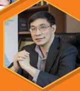
ดร.สมเกียรติ ตั้งกิจวานิชย์ ประธานสถาบันวิจัยเพื่อการพัฒนาประเทศไทย มูลนิธิสถาบันวิจัยเพื่อการพัฒนาประเทศไทย (ทีดีอาร์ไอ)