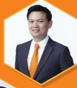
ศ.ดร.สุชัชวีร์ สุวรรณสวัสดิ์ อธิการบดี สถาบันเทคโนโลยีพระจอมเกล้าเจ้าคุณทหารลาดกระบัง