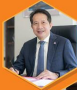
คุณสุพันธุ์ มงคลสุธี ประธานสภาอุตสาหกรรมแห่งประเทศไทย