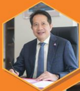
คุณสุพันธ์ มงคลสุธี ประธานสภาอุตสาหกรรมแห่งประเทศไทย