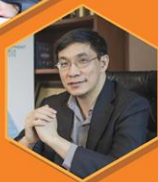
ดร.สมเกียรติ ตั้งกิจวานิชย์ ประธานสถาบันวิจัยเพื่อการพัฒนาประเทศไทย มูลนิธิสถาบันวิจัยเพื่อการพัฒนาประเทศไทย (ทีดีอาร์ไอ)