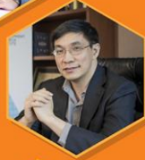
ดร.สมเกียรติ ตั้งกิจวานิชย์ ประธานสถาบันวิจัยเพื่อการพัฒนาประเทศไทย มูลนิธิสถาบันวิจัยเพื่อการพัฒนาประเทศไทย (ทีดีอาร์ไอ)