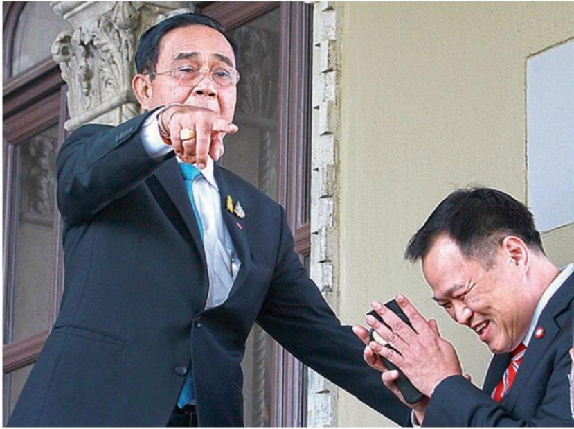
เอกอัครราชทูตจีนประจำประเทศไทย นายอู๋ อี้ซี - พล.อ.ประยุทธ์ จันทร์โอชา นายกรัฐมนตรี สนทนากับนายอนุทิน ชาญวีรกูล รองนายกรัฐมนตรี และ รมว.สาธารณสุข ภายหลังจากเสร็จสิ้นการประชุมคณะกรรมการนโยบายเขตพัฒนาพิเศษภาคตะวันออก โดยปฏิเสธที่จะให้สัมภาษณ์สื่อมวลชน ที่ทำเนียบรัฐบาล เมื่อวันที่ 18 ธันวาคม

ตรงความต้องการ เพิ่มมูลค่า สร้างรายได้เกษตรกรอย่างยั่งยืน และมอบหน่วยงานที่เกี่ยวข้องใช้แผนฯ เป็นกรอบในการขอรับงบประมาณปี 2565 เป้าหมายหลัก และเป็นแผนต่อเนื่องจนถึงปี 2570 ต้องการยกระดับภาคเกษตร ใช้เทคโนโลยีนำการผลิต สินค้าตรงตามความต้องการของตลาด เพิ่มรายได้ภาคเกษตร ใกล้เคียงภาคอุตสาหกรรม รวมทั้งเร่งรัดการลงทุนในโครงการระเบียงผลไม้ภาคตะวันออกที่จะส่งเสริมการเพิ่มมูลค่าการผลิตสินค้าเกษตรในอีอีซีให้มากขึ้นภายใต้การสนับสนุนการลงทุนของภาคเอกชน ได้แก่ บริษัท ปตท. จำกัด (มหาชน)