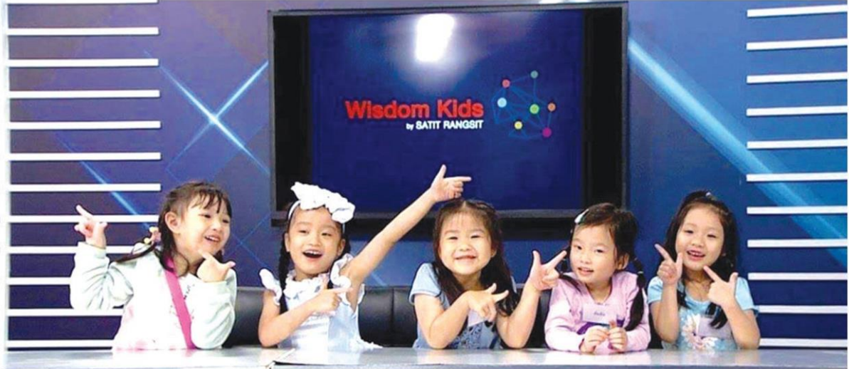
ภาพจากรายการ Wisdom Kids ทางสถานีโทรทัศน์ RSU TV

- จัดสรรงบประมาณรายปีในสัดส่วนที่เพียงพอต่อการบริหารงานของสถานี วิทยุกระจายเสียงและวิทยุโทรทัศน์สำหรับเด็กให้เป็นสถานีที่มีคุณภาพระดับมืออาชีพ