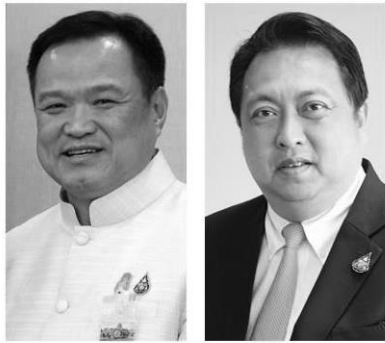
อนุทิน ชาญวีรกุล สุชาติ ชมกลิ่น