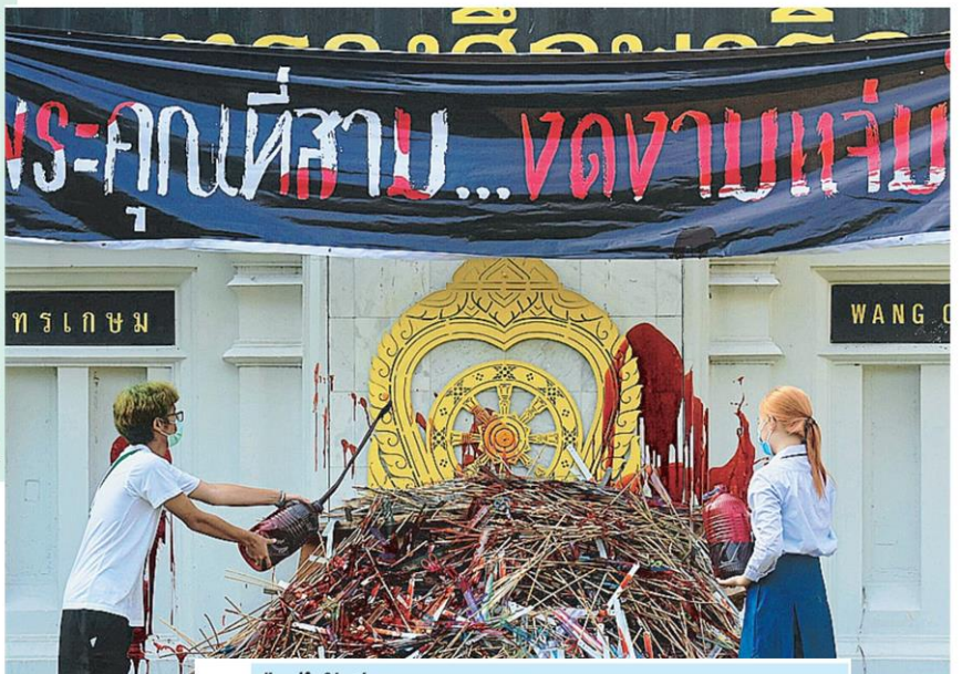
คืนไม่เรียว กลุ่มนักเรียนและเยาวชนในนามกลุ่ม "นักเรียนเลว" พากันสานผ้าแดงใส่กองไม้เรียว ระหว่างทำกิจกรรมเชิงสัญลักษณ์ในวันครูแห่งชาติ ปี 2564 "เอาไม้เรียวคืนไป เอาความปลอดภัยคืนมา" ที่หน้ากระทรวงศึกษาธิการ เรียกร้องให้ยุติความรุนแรงในสถานศึกษาทุกรูปแบบ.

ดร.เล่นเกมเร็วโจมรวบม็อบปลดแอก ผู้ชุมนุมจนจัดฮือด่าทอพร้อมโชว์ของลับ ใส่ ชูดำเนินคดีใช้ความ ★ มีต่อหน้า 11