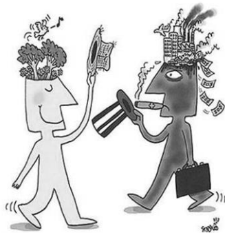
วันทนา คิระ - ศิลปิน: ชนิดา แบลมฟอร์ด 138

ความเป็นหนึ่งเดียว ปะทะ พวก 1% สลายมายาคติ เพาะเมล็ดพันธุ์เสรีภาพ