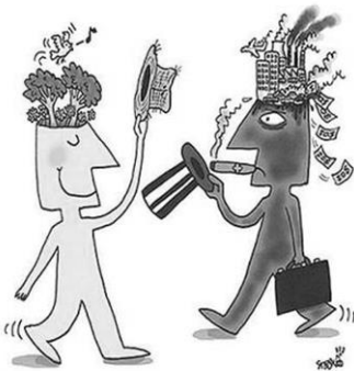
วันทนา คิระ - ศิลปิน วาดภาพ

ความเป็นหนึ่งเดียว ปะทะ พวก 1% สลายมายาคติ เพาะเมล็ดพันธุ์เสรีภาพ