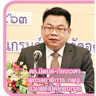
ดร.นิพัทธ์-กิ่งเวท พิเศษเลขาธิการ กพฐ. ร่วมพิธีเปิดโครงการ

โครงการส่งความรู้สู่เยาวชน ในวันนี้ (4 มีนาคม 2564) จะมีขึ้น ณ ห้องประชุม สำนักงานหนังสือพิมพ์เดลินิวส์ โดยพิธีเปิดโครงการนั้น ได้รับเกียรติจาก คุณหญิงกัลยา โสภณพนิช รัฐมนตรีช่วยว่าการกระทรวงศึกษาธิการ ในฐานะรักษาการ