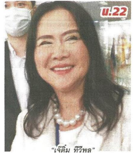
"เจ็ดทีม ทวีพูล"