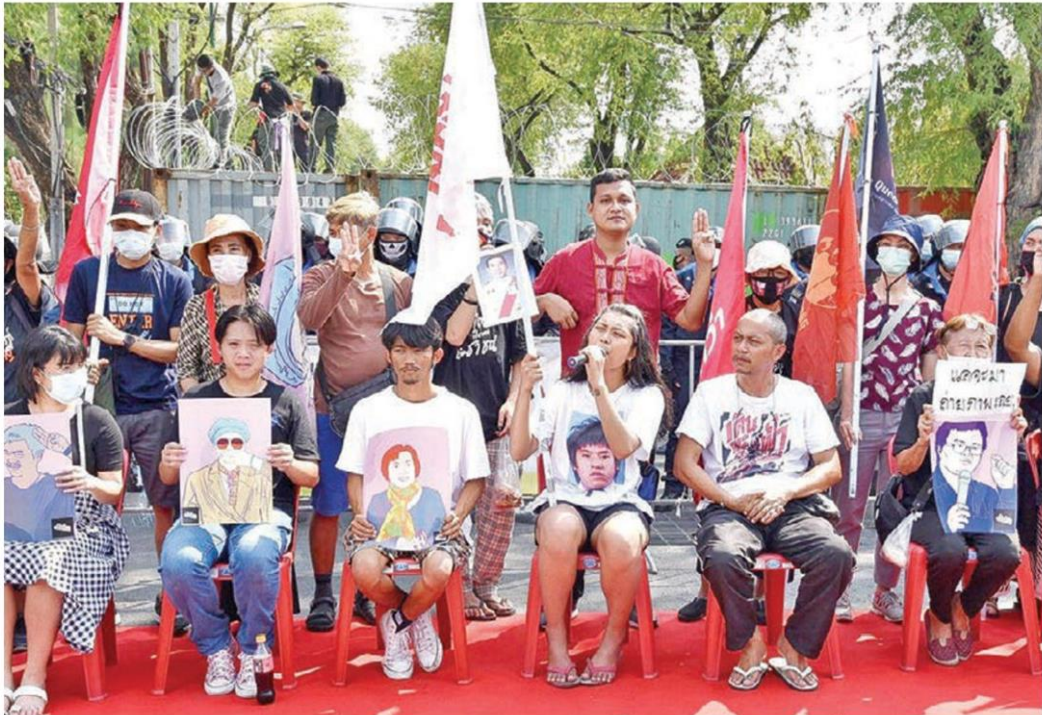
มือเป็ดเดินทะเลลูฟี่ รมว.จัดกิจกรรม "ถ่ายภาพ ครม.ฉบับประชาชน" เลียนแบบการถ่ายรูป ครม.บักตุ๋ 2/4 พร้อมเรียกร้องให้พล.อ.ประยุทธ์ จันทร์โอชา นายกรัฐมนตรีลาออก ยกเลิก ม.112 และปล่อยตัวแกนนำที่ถูกควบคุมตัวในเรือนจำ ที่บริเวณสะพานชมัยมรุเชฐ หน้าท่าเนียบรัฐบาล วานนี้ (30 มี.ค.)

ราชทัณฑ์ ในฐานะโฆษกกรมราชทัณฑ์ แถลงกรณีที่ไม่แสดงความเห็นต่อกรณีนายอานนท์ นาคภา ได้ยื่นคำร้องต่อศาลขอคุ้มครองความปลอดภัยชีวิตในเรือนจำพิเศษกรุงเทพมหานคร ว่า การดำเนินการของเจ้าพนักงานเรือนจำพิเศษกรุงเทพมหานครไม่ได้ใช้ความระมัดระวังอันกระทบต่อสิทธิของผู้ร้องกับพวกเท่าที่ควร และเห็นควรให้เจ้าหน้าที่โดยเจ้าพนักงานเรือนจำที่มีหน้าที่เกี่ยวข้อง ทำหน้าที่โดยใช้ความระมัดระวังเพื่อให้ผู้ร้องกับพวกได้รับการคุ้มครองตามสิทธิที่กฎหมายรับรอง