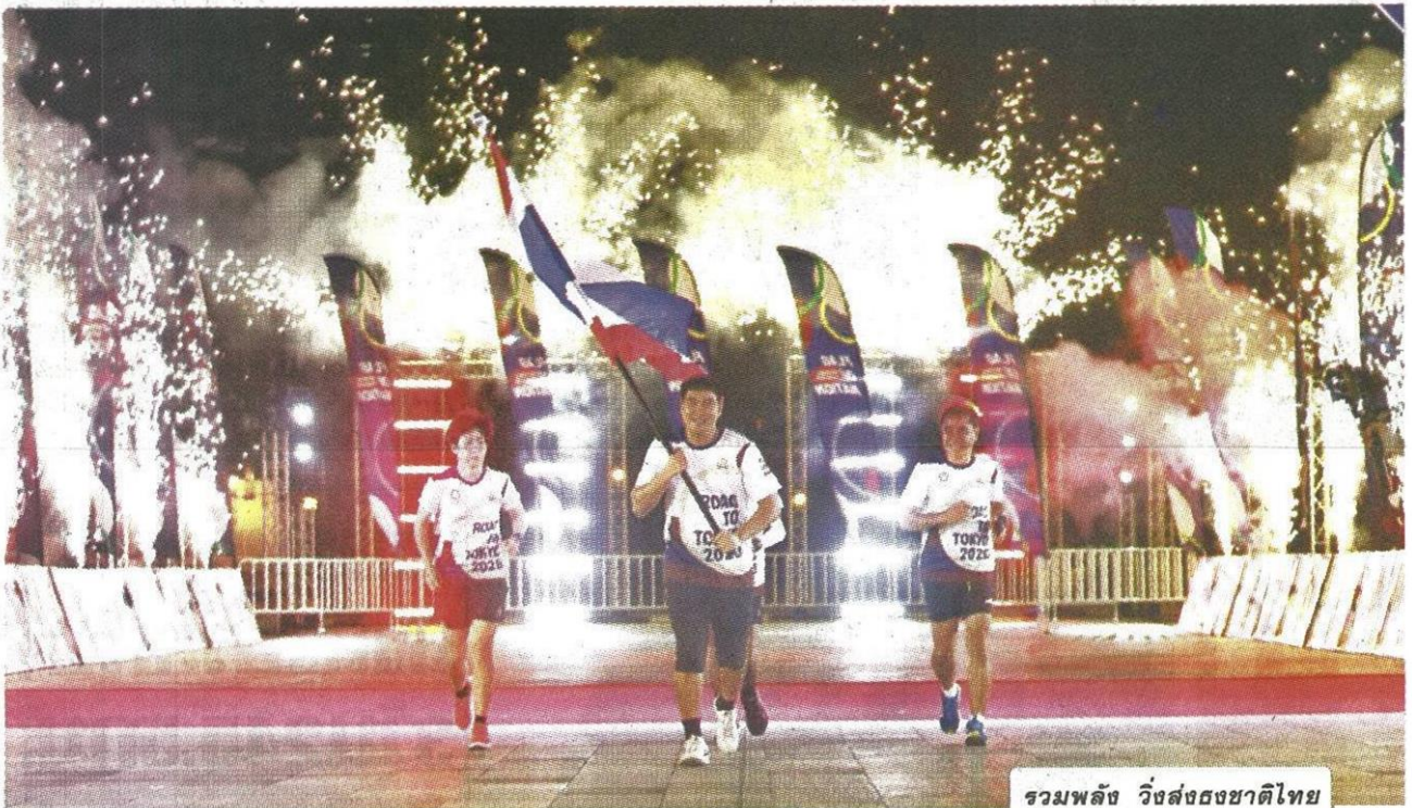
รวมพลัง วิ่งส่งธงชาติไทย ไปโตเกียว โอลิมปิก 2020

หลังจาก ไฟคบเพลิงกีฬาโอลิมปิก ฤดูร้อน ครั้งที่ 32 เริ่มกลับมาวิ่งอีกครั้งแล้ว เมื่อวันที่ 25 มีนาคมที่ผ่านมา