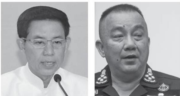
พลโทสรรเสริญ แก้วกำเนิด พลตำรวจเอกศรีวราห์ รังสิพราหมณกุล