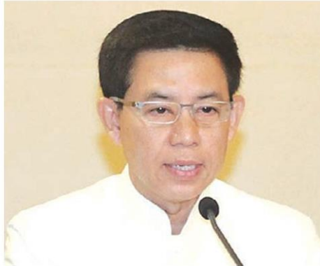
พลโทสรรเสริญ แก้วกำเนิด