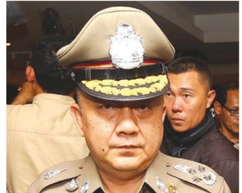
พลตำรวจเอกเกียรติวีระราช รังสิพรหมธมกุล