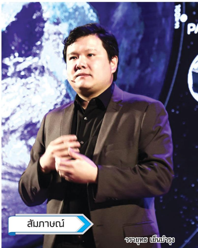
สัมภาษณ์