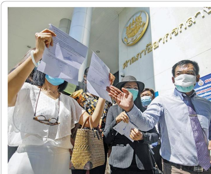
กลุ่มผู้ประกอบการสถานบริการเพื่อสุขภาพ สปาและร้านนวด ย่านสุขุมวิท เดินทางมายืนค้ำร้องเรียกรื้อถอนคำสั่งเสียหายจากกระทรวงการคลัง หลังจากที่ถูกกลุ่มผู้ประกอบการได้รับความเสียหายจากการบริหารงานที่ผิดพลาดของรัฐบาล ในสถานการณ์การแพร่ระบาดโควิด-19 ที่ศาลแพ่ง ถนนรัชดาฯ วานนี้ (17 ส.ค.)

ผู้จัดการรายวัน360° - ไทยติดเชื้อเพิ่ม 20,128 ราย เสียชีวิตทำสถิติใหม่ 239 ราย ผู้ป่วยอาการหนัก 5,536 ราย ใส่เครื่องช่วยหายใจ 1,169 ราย ครม.ไฟเขียว 9,372 ล้านบาท ซื้อ “ไฟเซอร์” 20 ล้านโดส และให้จัดหาเพิ่มอีก 10 ล้านโดส รวม 30 ล้านโดส ยันไม่มีวีไอพีได้ไฟเซอร์บูสเตอร์โดสเข็ม 3 “แพทย์ชนบท” ตั้งทีม 60 ทีม พร้อมลุยตรวจคุณภาพ ATK ทันที ขณะที่ อก.เดินหน้าเซ็นสัญญาซื้อชุดตรวจ ยันคุณภาพตามมาตรฐาน อย.