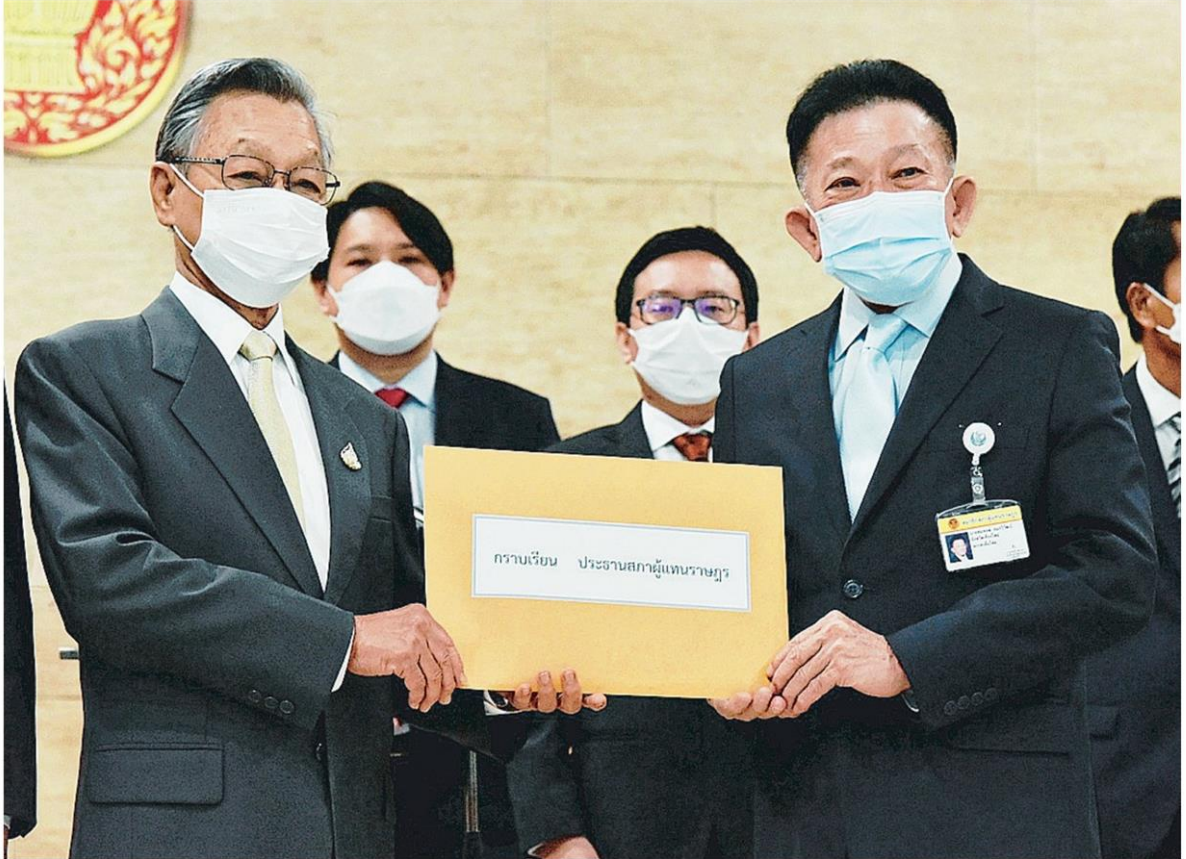
▲ ซักฟอก 6 รมต. นายสมพงษ์ อมรวิวัฒน์ ผู้นำฝ่ายค้าน ยื่นญัตติขอเปิดอภิปรายไม่ไว้วางใจ พล.อ.ประยุทธ์ จันทร์โอชา นายกรัฐมนตรี และ รมว.กลาโหม พร้อมรัฐมนตรีรวม 6 คน ต่อนายชวน หลีกภัย ประธานสภาฯ พุ่งเป้าซักฟอกการแก้ไขปัญหาโควิด-19 บกพร่องล้มเหลว ทำให้ประเทศเสียหายร้ายแรงทุกด้าน.