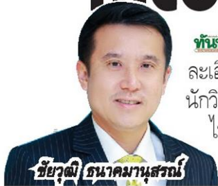
ชัยวุฒิ ธนาคมานุสรณ์

ทับทิม - รัฐมนตรีดีอีเอส สั่งสัญญาไม่รับประมูลดาวเทียม ซึ่งเป็นเรื่องละเอียดอ่อน แคมต้องรอบอर्ड กสทช. ชุดใหม่ ก่อนประชุมหลายฝ่าย นักวิเคราะห์ชี้ THCOM ไม่กระทบ เหตุพุ่งเป้าไปยังการบริหารดาวเทียมไทยคม 4 และ 6 กับ NT คักยภาพการดำเนินธุรกิจสูง รอรัฐบาลจัดประมูลภายในปี 2565 →→→ อ่านหน้า 2