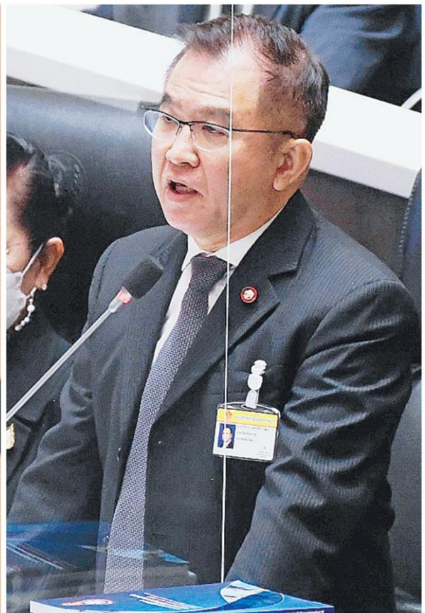
▲ ปุดแจก 5 ล้าน นายวิสาร เตชะธีราวัฒน์ ส.ส.เชียงราย พรรคเพื่อไทย เปิดเผยขณะอภิปรายไม่ไว้วางใจรัฐบาล โดยกล่าวหา พล.อ.ประยุทธ์ จันทร์โอชา นายกฯ กำลังจ่ายเงินให้ ส.ส.คนละ 5 ล้านบาท ที่ห้องทำงานชั้น 3 ขณะที่นายกฯตอบโต้ยืนยันไม่ทำอะไรบ้างบอๆ ไม่ทำถูกขมจนแจกอยู่แล้ว