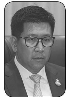
ดร.เอกนิติ นิตัตถ์ประกาศ

หนอ..จะสมัครชิงตำแหน่งเลขาธิการ กสทช. ที่เปรียบเป็นเสมือนแม่บ้าน มือชง ทุกเรื่องทุกอย่างให้กับประธานบอร์ดและ กก.ทุกคน รวมทั้งค่ายโทรคมนาคมทั้งหมด เพราะมีการกิจสำคัญรออยู่ ไม่ว่าจะเป็นการประมูลวิทยุดิจิทัล ที่จะเริ่มเดือนมีนาคม-เมษายนศกนี้ และการประมูลดาวเทียมแทน บมจ.ไทยคม ..ฮอตๆ ทั้งนั้น แถมยังมีเรื่องการหลอมรวมเทคโนโลยี (อนุมัติให้กลุ่มธุรกิจอื่นสามารถมาทำโทรคมนาคมได้) ซึ่ง ครม.อนุมัติไปนานแล้ว แต่อ่านจอยู่ที กสทช.ในการออกกฎหมายประกอบกิจการ ซึ่งทุกฝ่ายร้องเพลงรอ...กันอยู่ ...● ร้อนๆ จนไฟจี้บนท้าย ณานาที่ที่ต้องจับตามองไปจนถึงก่อนวันตรุษจีน ก็ไม่พ้นประเด็นร้อนแรงที่กรมสรรพากรประกาศเก็บภาษีกำไรจากการขายคริปโตเคอร์เรนซี จนเมื่อวานนี้ถูกม็อด “แอ็ก” ทวิตเตอร์เล่นสนุกชวนลงทุน NFT กันยกใหญ่ งานนี้ ดร.เอกนิติ นิตัตถ์ประกาศ อธิบดีกรมสรรพากรอาจจะตอบนึมๆ ตามสโลล์สุภาพบุรุษ