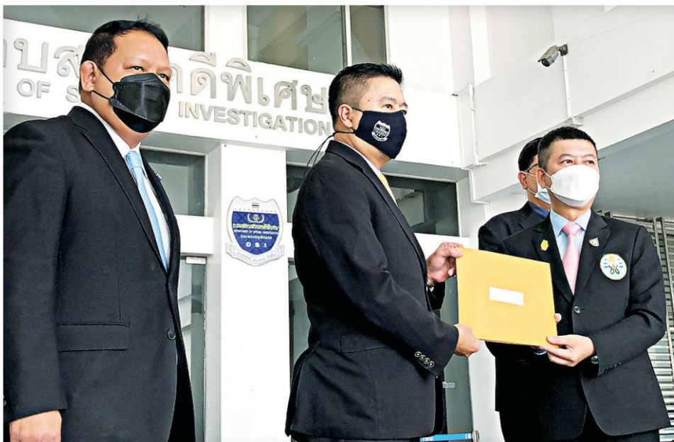
▲ หมอบุก...นพ.อิทธิพร คณะเจริญ เลขธิการแพทย์สภา นำแพทย์ผู้เสียหายกรณีถูกแก๊งคอลเซ็นเตอร์แอบอ้างเป็นเจ้าหน้าที่ดีเอสไอหลอกว่าเกี่ยวข้องกับผู้ต้องหาคดีฟอกเงิน ให้ทางดีเอสไอตรวจสอบ

ที่กรมสอบสวนคดีพิเศษ (ดีเอสไอ) เมื่อวันที่ 18 ม.ค. นพ.อิทธิพร คณะเจริญ เลขธิการแพทย์สภา นำแพทย์ผู้เสียหายกรณีถูกแก๊งคอลเซ็นเตอร์แอบอ้างเป็นเจ้าหน้าที่ดีเอสไอ หลอกว่าเกี่ยวข้องกับผู้ต้องหาคดีฟอก