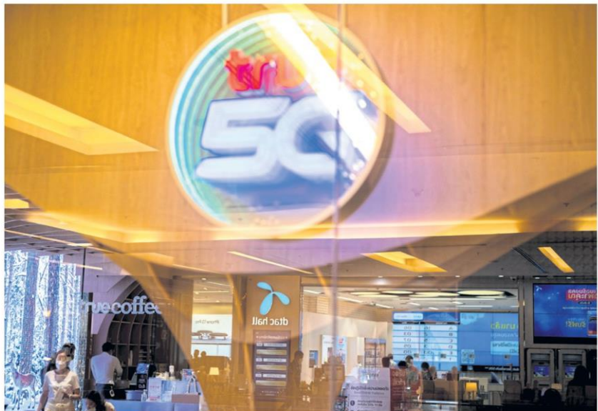
Logos of True Corporation and DTAC are seen at a department store.

telecom industry have been executed since the amended act was enforced, comprising ALT Telecom and International Gateway in 2019, ALT Telecom and Smart Infranet in 2020, TOT and CAT Telecom in 2021, and Triple T