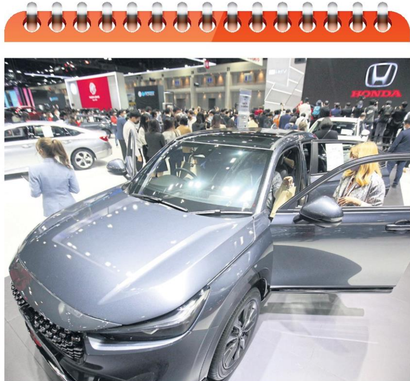
People check out automobiles at last year's Motor Expo.

→ MONDAY: "Furniture Living & Design 2022" takes place at Bitec Bang Na from today until June 5. The event is open to the public from 10.30am until 8.30pm in Event Halls 103-104.