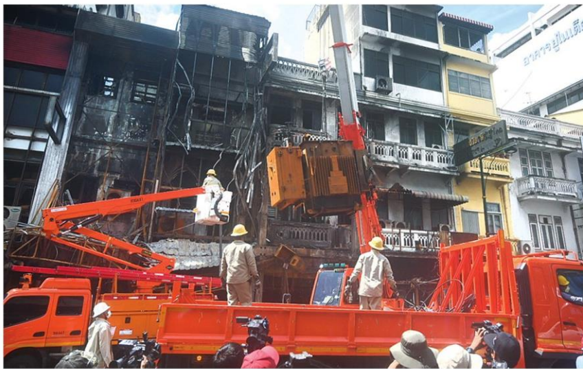
☒ ตรวจสอบ - เจ้าหน้าที่เขตสัมพันธวงศ์ พร้อมเจ้าหน้าที่การไฟฟ้านครหลวง ตรวจสอบอาคารในตลาดสำเพ็ง กทม. หลังเหตุไฟไหม้ โดยเตรียมเยียวยาผู้ได้รับความเดือดร้อน และตรวจสอบหม้อแปลงไฟฟ้าอันตรายอีก 400 ลูก เมื่อวันที่ 27 มิ.ย.

วันเดียวกัน นายเกียรติศักดิ์ แซ่เต้ เจ้าของตึกที่ขายของใช้ตึก 1 ในตึกที่ได้รับความเสียหายจากเพลิงไหม้ เปิดใจกับ 'ข่าวสด' ว่า เมื่อวานทางร้านปิดให้บริการ ไม่เช่นนั้นคนและลูกจ้างอีก 5-6 คน ไม่รู้จะมีชะตากรรมเป็นเช่นไร รู้สึกเห็นใจกับผู้เสียชีวิตทั้ง 2 ราย อยากให้ดูแลในเรื่องผู้เสียชีวิตทั้งสองราย และทรัพย์สินในบ้านเรือนอื่นๆ ที่เสียหายจากเหตุการณ์นี้ ประชาชนธรรมดาไม่สามารถดูแลเองได้ นอกจากจะต้องแจ้งหน่วยงานที่รับผิดชอบหม้อแปลงเก่ามากอะไรที่จะเปลี่ยนมันก็ต้องเปลี่ยน อย่าให้เกิดเหตุโศกนาฏกรรมแล้วค่อยมาแก้ที่หลัง ตึกแถวของคนเสียหายทั้งหลัง ชาวของและทรัพย์สินต่างๆ ก็เสียหายด้วย