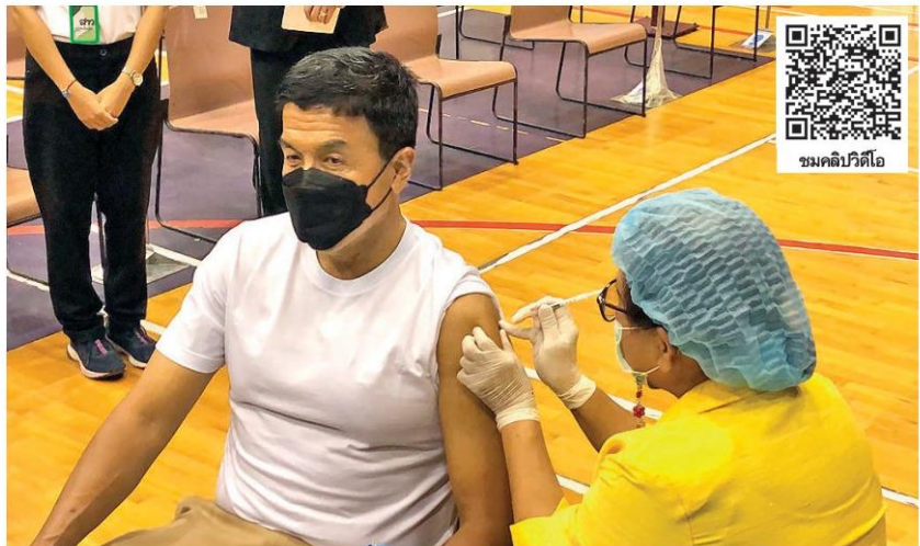
บูสเตอร์เข็ม 5 - นายชัชชาติ ลิทธิพันธุ์ ผู้ว่าฯกทม. เข้ารับการฉีดวัคซีนป้องกันโรคโควิด-19 เข็มกระตุ้น (บูสเตอร์โดส) เข็มที่ 5 เพื่อรณรงค์ให้ประชาชนเห็นความสำคัญและรับการฉีดวัคซีนเข็มกระตุ้นตามระยะเวลาที่เหมาะสม ที่อาคารกีฬาเวสน์ 1 สนามกีฬาไทย-ญี่ปุ่น ดินแดง เมื่อวันที่ 27 มิถุนายน

ด้านนายสุชาติ ชมกลิ่น รัฐมนตรีว่าการกระทรวงแรงงาน กล่าวว่า ได้สั่งการให้กรมสวัสดิการและคุ้มครองแรงงาน (กสร.) ส่ง