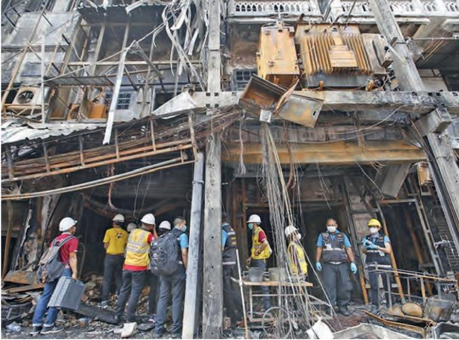
ตรวจสอบ - เจ้าหน้าที่สำนักโยธาธิการและผังเมือง สภาวิศวกร และกรุงเทพมหานคร (กทม.) ได้ลงพื้นที่ตรวจสอบอาคารพาณิชย์ที่เกิดเหตุเพลิงไหม้ย่านสำเพ็ง ถ.ราชวงศ์ เพื่อดูว่าอาคารยังมีความแข็งแรงและปลอดภัยหรือไม่ ก่อนที่จะดำเนินการในขั้นตอนต่อไปว่าจะให้ใช้อาคารต่อ หรือต้องทำการรื้อถอน