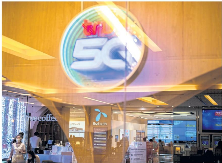
Logos of True Corporation and DTAC Plc are seen at a department store in Bangkok. The two firms announced a proposed merger in November 2021.

"After the deal is concluded, we would see a more healthy performance by players as their profit mar-