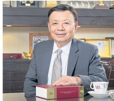
Mr Takorn said the state should create a 'One smart hospital, one region' scheme.

The 5G network could support the management of patients' data and