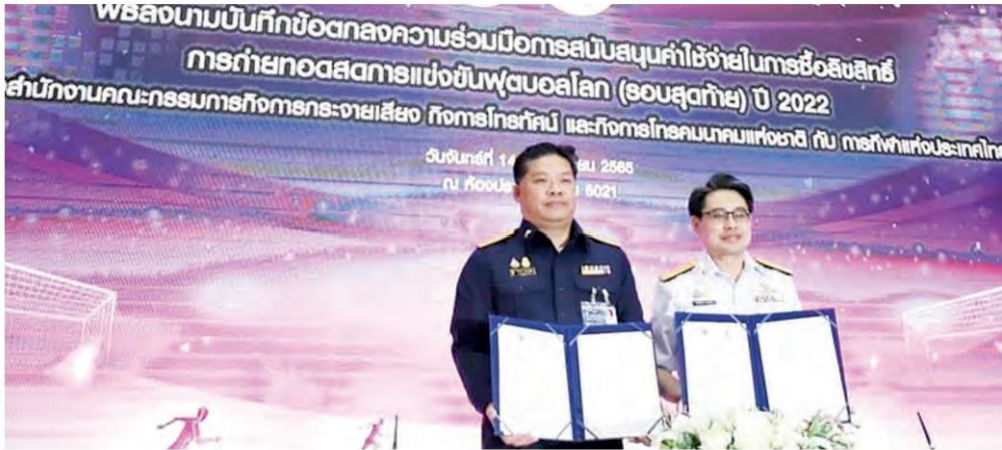
ดร.ก้องศักดิ์ ยอดมณี ผู้ว่าการการกีฬาแห่งประเทศไทย

การกีฬาแห่งประเทศไทย ได้รับเงินสนับสนุนในการซื้อลิขสิทธิ์การถ่ายทอดสดฟุตบอลโลก 2022 รอบสุดท้ายที่ประเทศกาตาร์ จากสำนักงานคณะกรรมการการกระจายเสียง กิจการโทรทัศน์ และกิจการโทรคมนาคมแห่งชาติ หรือ กสทช. จำนวน 600 ล้านบาท ซึ่งมีการเซ็นสัญญาลงนามบันทึกข้อตกลงอย่างเป็นทางการ (MOU) ในวันที่ 14 พฤศจิกายน 2565