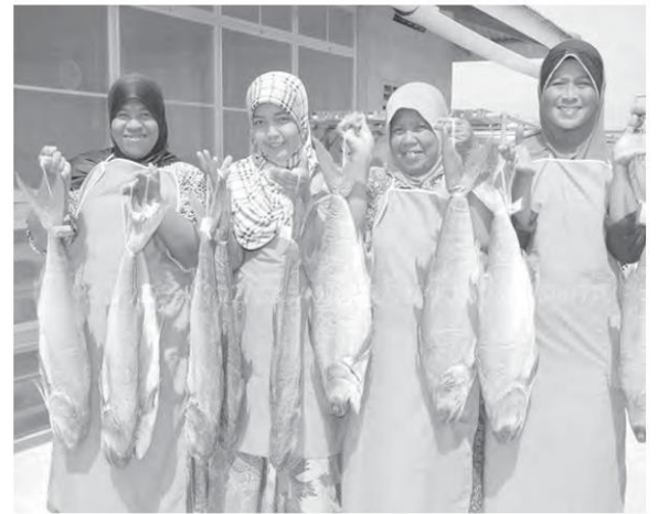
ปลากุเลาตากใบ

ถามไปยังชาวบ้านกลุ่มวิสาหกิจชุมชนโอริงปันตัย จ.ปัตตานี ที่ถูกเอามาไปใช้ประกอบการแถลงข่าว ก็บอกว่า ไม่มีการสั่งปลากุเลาเค็มจากกลุ่มของพวกเขาด้วยเช่นกัน จึงเกรงว่าจะเกิดการเข้าใจผิดได้