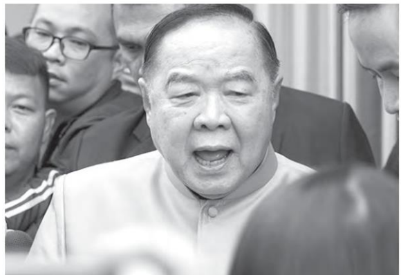
พล.อ.ประวิตร วงษ์สุวรรณ

เรียกว่า จบด้วยการที่คนไทยได้ดูบอลโลก เงินหลวงบวกสปอนเซอร์ควักเงินลงขัน คนละ 100-200 ล้าน พอจ่ายค่าลิขสิทธิ์พอดิบพอดี