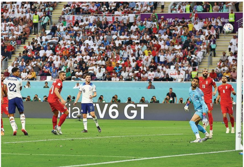
เบ็กสเกอร์ - จู๊ด เบลลิงแฮม มิดฟิลด์ทีม "สิงโตคำราม" อังกฤษ โหม่งสะบัดเสียบเสาสองประตูเบ็กร่องให้ทีมออกมา อิหร่าน ก่อนจะถล่มชนะไป 6-2 ในการแข่งขันฟุตบอลโลก 2022 นัดแรก กลุ่มบี ที่คาลิฟา อินเตอร์เนชั่นแนล สเตเดียม ประเทศกาตาร์ เมื่อวันที่ 21 พฤศจิกายน

คู่นี้ไม่เคยพบกันมาก่อนเลย เริ่มครั้งแรกอังกฤษครองบอลได้มากกว่า ขึ้นเกมรุกทั้งซ้ายและขวา แต่ยังเน้นรัดกุม ไม่ทุ่มทุ่ม นาทีที่ 5 เกมต้องหยุดเกือบ 10 นาที เพราะต้องปฐมพยาบาล อาลีเรซ่า เบรานานานด์ ประตูอิหร่านที่ไปชนกับกองหลังจนตั้งงมมีปัญหา สุดท้ายฟื้นเล่นต่อไม่ไหวต้องเปลี่ยน ฮุสเซน โฮสเซนี่ ลงมาแทน