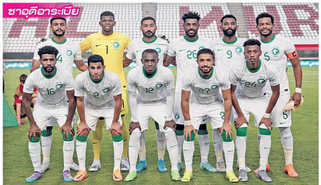
ชาอุดีอาระเบีย

▶ ลุ้นกันหยด... ขุนพลนักเตะ “ฟ้าขาว” อาร์เจนตินา อดีตแชมป์โลก 2 สมัย นำโดยหัวหอก “ลิโอเนล เมสซี” ที่ครองสถิติไม่เคยแพ้ใครมาถึง 36 นัดติดต่อกัน นับตั้งแต่แพ้บราซิล 2-0 ในถ้วยโกปาลิอเมริกา ค.ศ. 2019 โดยผลงานล่าสุดอุ่นเครื่องชนะยูเออี 5-0 นัดนี้เตรียมลงจลวแข่งประเดิมกับ “ทีมเศรษฐีน้ำมัน” ชาอุดีอาระเบีย ในรอบสุดท้ายของศึกฟุตบอลโลก 2022 กลุ่ม C วันที่ 22 พ.ย. เวลา 17.00 น. ที่ประเทศกาตาร์