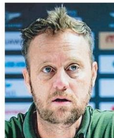
มาโน โพลกิง

เซ็นทรัล มารินา ชลบุรี, เซ็นทรัล นครราชสีมา, เซ็นทรัล หาดใหญ่ สงขลา และโรบินสัน ไลฟ์สไตล์ สุพรรณบุรี อยากดูบอลให้คลิกคลิก มีสิทธิ์ลุ้นได้ที่ไหน ตามสะดวกได้เลย ■ สมาคมกีฬาฟุตบอลฯ แจ้งข่าว เปิดจำหน่ายบัตรรอบทั่วไป ฟุตบอลชิงแชมป์อาเซียน 2022 รอบแบ่งกลุ่ม กลุ่มเอ 2 นัดเหย้า ของทีมชาติไทย ภายใต้การคุมทัพของ มาโน โพลกิง ทุนซื้อใหญ่ช่วงศึกวันที่ 26 ธ.ค.2565 จะพบทีมชาติฟิลิปปินส์ ที่สนามกีฬาธรรมศาสตร์ เวลา 19.30 น. และวันที่ 2 ม.ค.2566 รอเจอทีมชาติกัมพูชา ที่สนามกีฬา