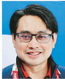
ดร.ก้องศักดิ์ ยอดมณี

■ ฟุตบอลโลก กาตาร์ 2022 ค่อยๆขยับเข้าสู่จุดไคล์แม็กซ์ทีละนิดแล้ว วันนี้ (6 ธ.ค.) เป็นคิวฟาดแข้งรอบน็อกเอาต์ 16 ทีม เป็นวันสุดท้าย โมร็อกโก ดวลเดือด สเปน เวลา 22.00 น. ทางทรูโฟร์ยู 24 และโปรตุเกสปะทะ สวิตเซอร์แลนด์ เวลา 02.00 น. ทางจีเอ็มเอ็ม 25 แฟนบอลห้ามพลาดติดตามกันได้ชาติใดจะได้ทะลุเข้ารอบ 8 ทีมสุดท้าย ลุ้นไปพร้อมๆกัน ■ ว่ากันถึงศึกเวโลดคัพครั้งนี้ อีกหน่อย ตอนแรกคิดว่าได้ลิขสิทธิ์ถ่ายทอดสดกันมาแล้ว ทุกอย่างจะเรียบร้อย ไม่มีปัญหาอื่นตามมา แต่ที่ไหนได้ปาเข้ารอบ 2 ไปแล้ว เรื่องวุ่นๆช่องทางถ่ายทอดสดที่แย่งกันไปมา ยังมีตามมาไม่เว้นแต่ละวัน เข้าใจว่าของอย่างนี้มองกันได้ง่ายๆ แต่ต้นทางจริงๆแล้ว ต้องย้อนกลับไปตั้งแต่แรก ตอนที่หาคนลงขันเรียบกันหมด หายหัว แต่พอ กทท.คว่ำสิทธิ์มาได้คนที่เคยเจียบกลับมาเสียงดังกันเป็นแถว แถมจะเอาโนน เอานี้ เอ้อ...ต้องถอนหายใจตั้งๆ ■ เพื่อใครยังไม่ทราบ ประชาสัมพันธ์ให้กับแฟนบอลที่สนใจ กทท. โดย ดร.ก้องศักดิ์ ยอดมณี ผู้ว่าการ กทท.และ กสทช.ร่วมกันจัดกิจกรรมชมเชียร์ฟุตบอลโลกครั้งนี้ ผ่านทีวีจอยักษ์ ทั้งในกรุงเทพฯ และภูมิภาค โดยในส่วนกลาง จัดที่ Groove@CentralWorld กรุงเทพฯ ■ ขณะที่ต่างจังหวัด จัดที่เซ็นทรัลเชียงใหม่ แคร่พอร์ด