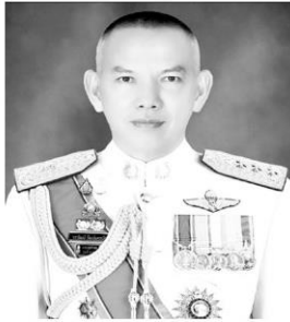
พล.ต.ท.วรวัฒน์ วัฒนนครบัญชา