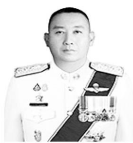
พล.ต.ท.นิษวัฒน์ ณะเด็มชิต