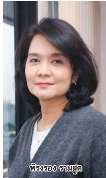
พิรงรอง งามสุด

“ปัจจุบันรัฐบาลได้มอบหมายให้ ปก. เป็นหน่วยงานหลักในการออกข้อความแจ้งเตือนไปยังประชาชน จึงมีความชัดเจนถึงหน่วยงานที่มีหน้าที่กลั่นกรองและแจ้งข่าว รวมทั้งได้กำหนดแนวทางปฏิบัติในการแจ้งเตือนภัยผ่านสัญญาณมือถือ หรือระบบ Cell Broadcast แล้ว แต่ถ้าเครือข่ายมือถือล้ม ประชาชนก็จะไม่ได้รับข่าว จึงสมควรที่จะดำรงไว้ซึ่งสื่อกระจายเสียงให้เป็นอีกช่องทาง”